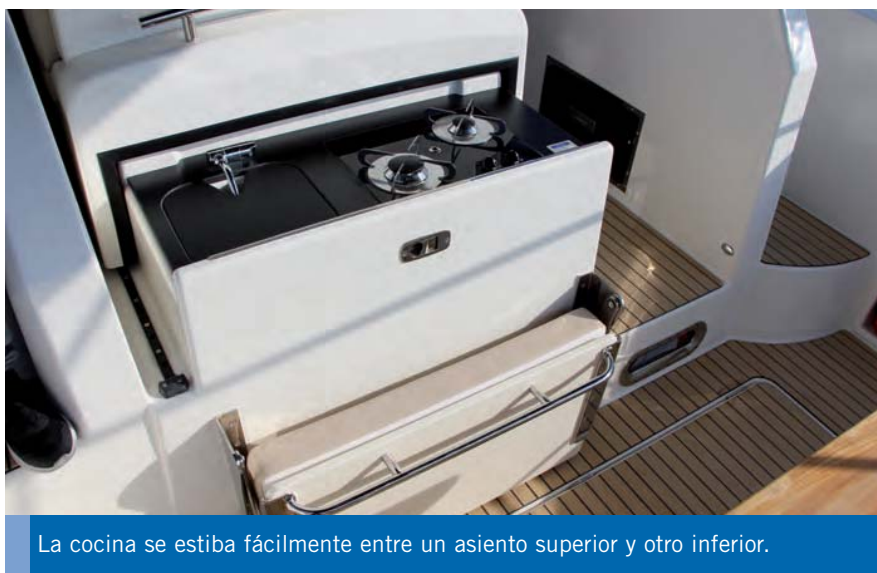
La cocina se estiba fácilmente entre un asiento superior y otro inferior.