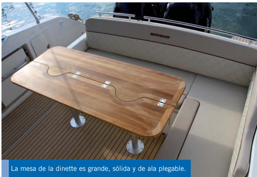
La mesa de la dinette es grande, sólida y de ala plegable.