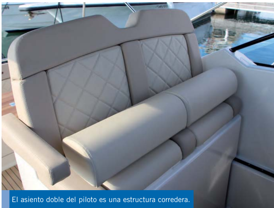
El asiento doble del piloto es una estructura corredera.

La cabina, bien integrada bajo la cubierta, ofrece un volumen mayor de lo esperado, con un espacio acogedor marcado por la luminosidad que proporciona el acristalamiento de las bandas.