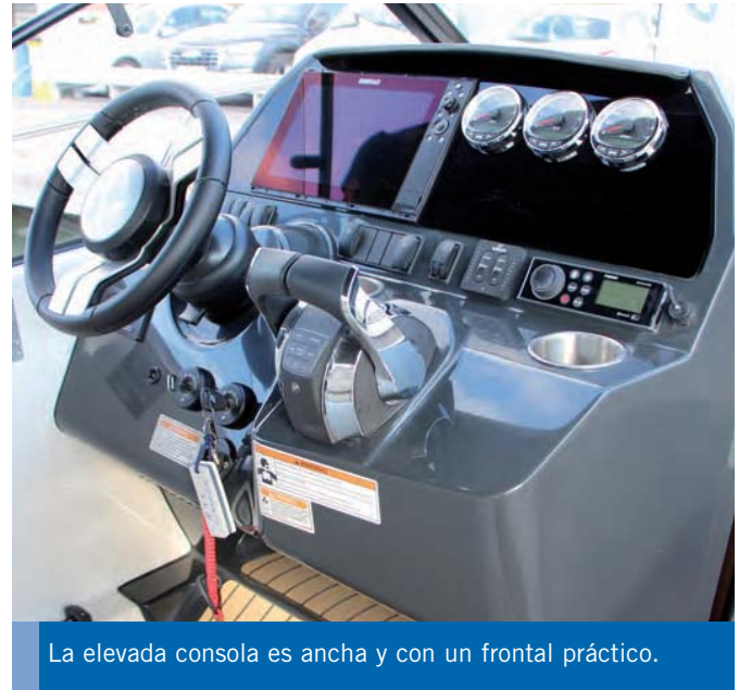
La elevada consola es ancha y con un frontal práctico.

con una gran toldilla bimini de altura ajustada por proa.