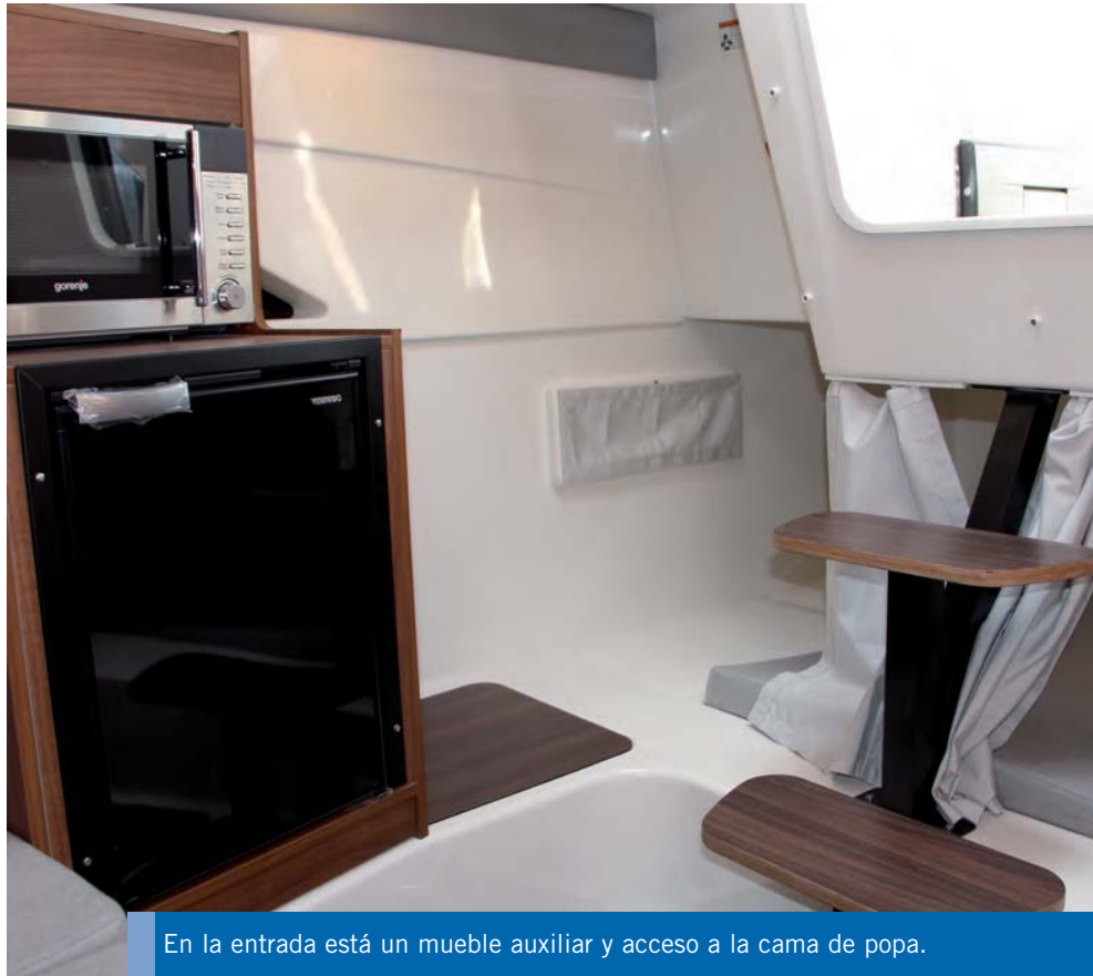
En la entrada está un mueble auxiliar y acceso a la cama de popa.

Con el mar bastante tranquilo, la navegación resultó agradable y la embarcación se mantuvo estable a máximo régimen, con una buena adaptación en los cruces de estelas de cierta importancia y un ritmo de crucero entre 26 y 31 nudos que nos permitió encadenar sin problemas giros de forma segura. ◻