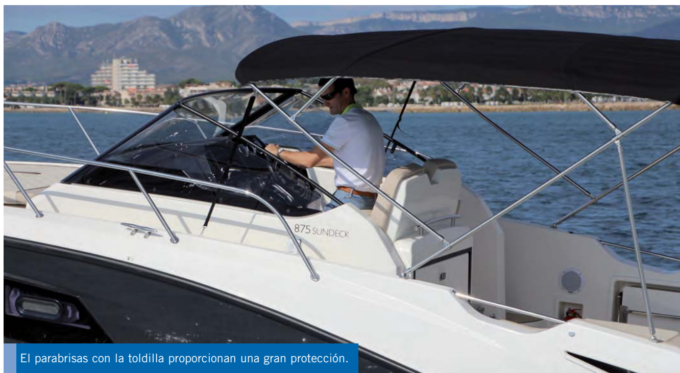
El parabrisas con la toldilla proporcionan una gran protección.

La línea Activ Sundeck de Quicksilver comprende cruceros con grandes aptitudes para tomar el sol y una disimulada cabina bajo cubierta, que además se pueden utilizar para actividades costeras como la pesca, permitiendo una buena combinación entre nuestra afición y las necesidades familiares. De hecho, la presentación de la nueva Activ 875 Sundeck ha permitido a Quicksilver aumentar la eslora de su línea Sundeck sin necesitar por ello más que la titulación del PNB para su manejo, haciéndola de este modo más asequible a un público más variado.