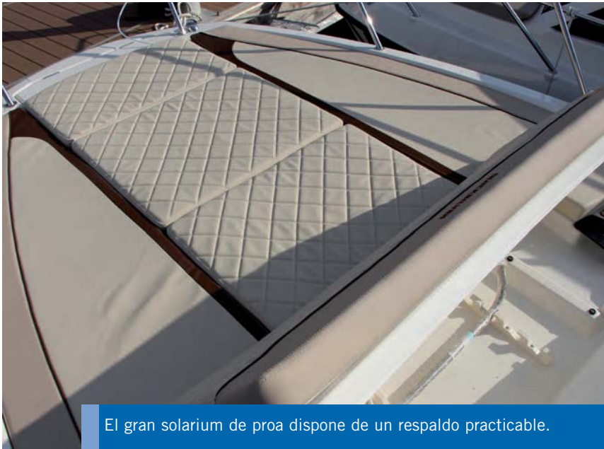
El gran solarium de proa dispone de un respaldo practicable.