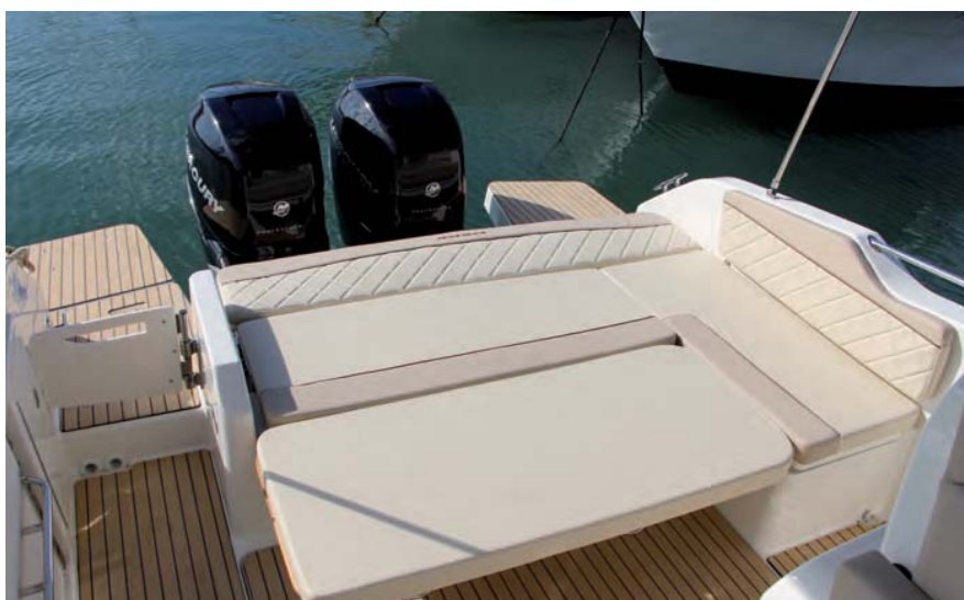
Con el respaldo abatible y la mesa se puede formar un solarium en popa.