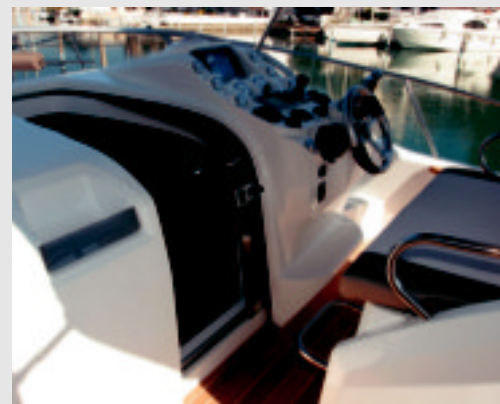
El puesto de mando, parapetado con un deflector, es central para dos y posee una gran consola.

R obustez, volumen y un perfil muy actual es lo que denota esta day cruiser de 9 metros. Una propuesta que ofrece en su parte delantera un gran solario entre el cofre del equipo de fondeo y los dos huecos para defensas y la elevación del puesto de gobierno. Bajo las colchonetas hay una escotilla circular que da al salón y un práctico cofre con un pistón de gas para meter pequeños objetos. En los guardamancebos de inox. de las amuras se han insertado acolchados cilíndricos insertados para poder apoyarse