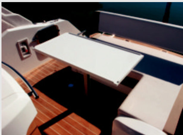
La bañera se convierte en una gran solario al retirar la mesa.

La reserva de potencia permite exprimir los motores al límite hasta los 43 nudos