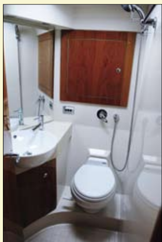
Éste es el aseo de invitados, con lavamanos, inodoro y ducha.