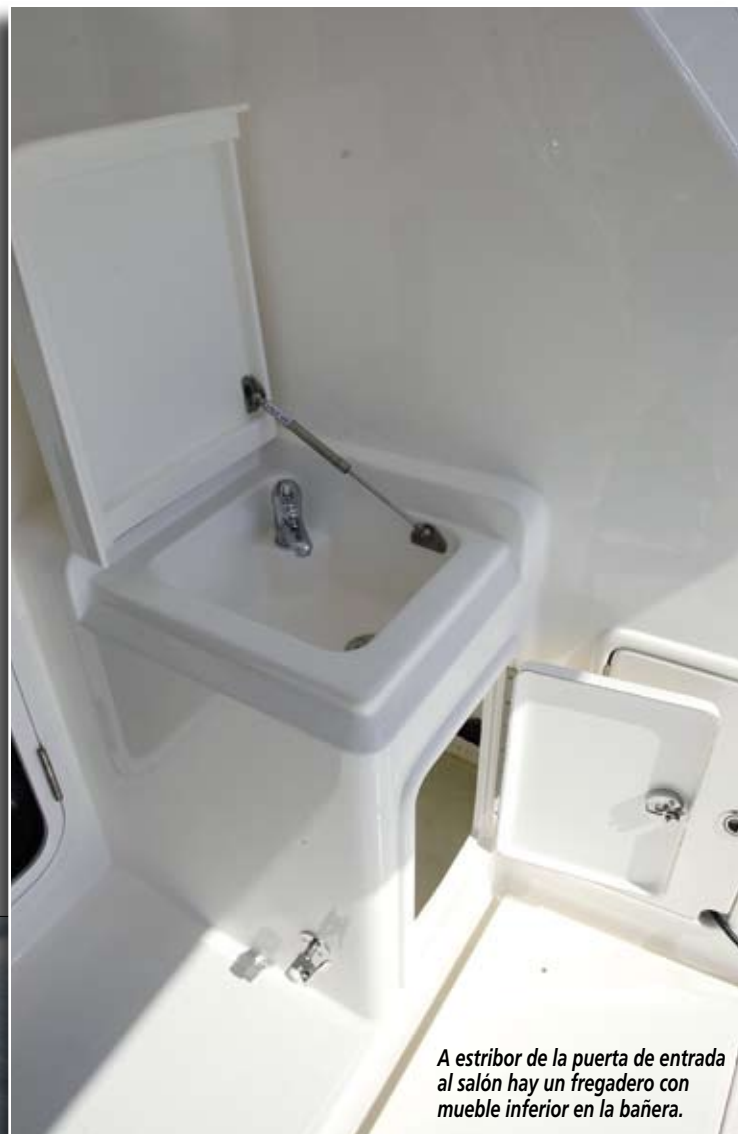
A estribor de la puerta de entrada al salón hay un fregadero con mueble inferior en la bañera.