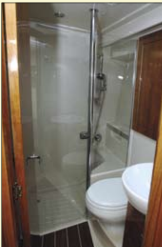
En el camarote del armador hay un completo cuarto de baño que incluye ducha independiente.

▲ El camarote del armador, a proa, incluye una gran cama central.