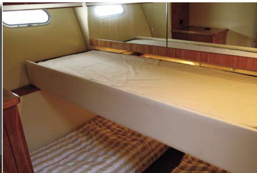
Para los invitados se han dispuesto dos literas paralelas, aunque existe una tercera superior extraíble.