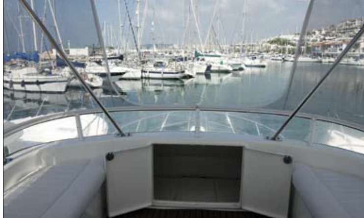
El área del fly tiene numerosos asientos acolchados con capacidad de estiba en su interior, así como en la zona de proa.