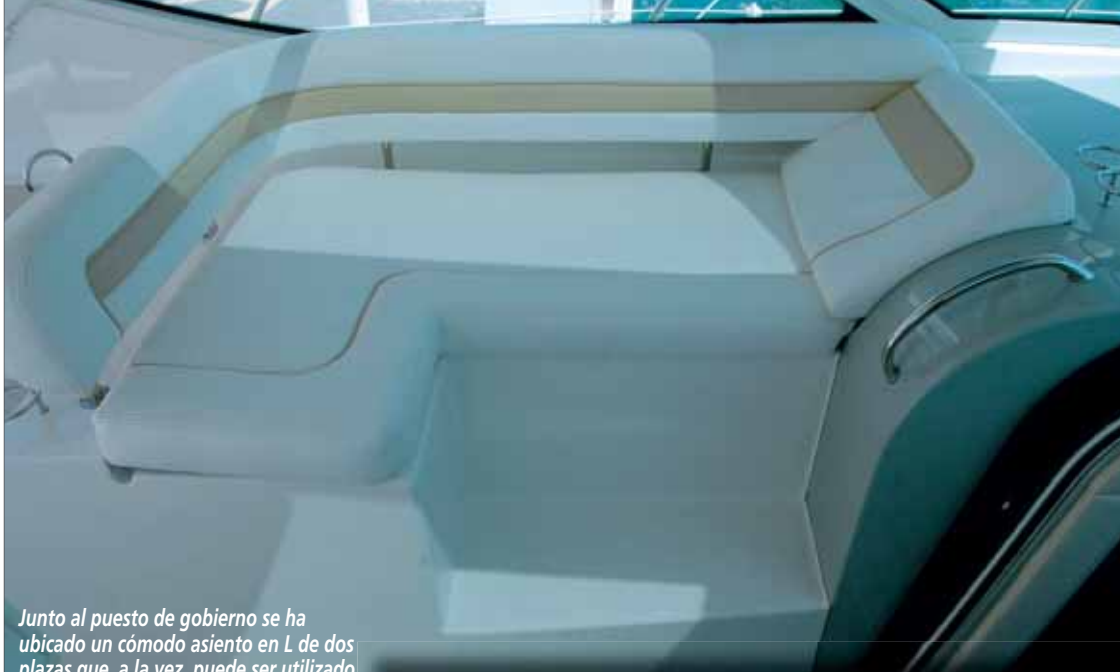
Junto al puesto de gobierno se ha ubicado un cómodo asiento en L de dos plazas que, a la vez, puede ser utilizado como diván gracias al respaldo reclinado instalado en el mamparo de proa.

Su deportividad viene marcada tanto por su diseño y tipología como por la motorización instalada. En este sentido, las casi 13 toneladas de peso de esta