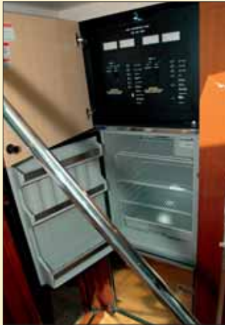
La cocina cuenta con frigorífico y congelador. Encima de ésta, una tapa de armario oculta el cuadro eléctrico de la embarcación.