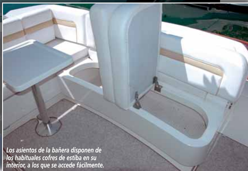
Los asientos de la bañera disponen de los habituales cofres de estiba en su interior, a los que se accede fácilmente.