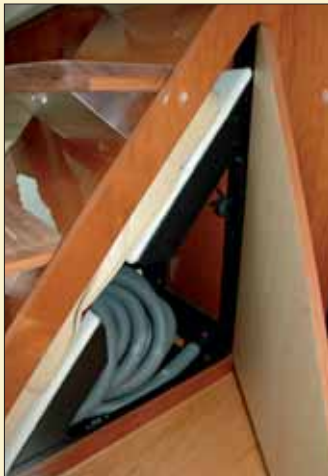
Como opcional, se ofrece la posibilidad de instalar en el espacio situado bajo la escalera de acceso al interior de la embarcación un sistema de aspiradora central.

un ambiente cálido e íntimo profusamente rematado en madera. Dispone de una litera doble central de 2,10 x 1,40 metros que prácticamente ocupa toda la parte delantera de la estancia, con guanteras laterales con tapa y armarios altos, y deja la zona de entrada con armarios a banda y banda y un pequeño vestíbulo que da acceso al cuarto de ducha independiente instalado a estribor y al cuarto de aseo, de elegante y refinado diseño, a babor.