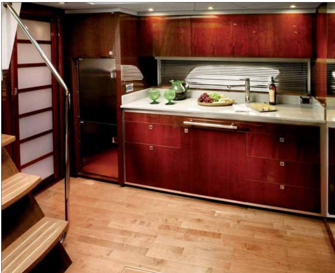
▲ Bajando cuatro peldaños se accede, en un nivel inferior, al interior de la embarcación, donde la zona de babor acoge una completísima y amplia cocina que mantiene el lujo y el confort del resto de la embarcación.