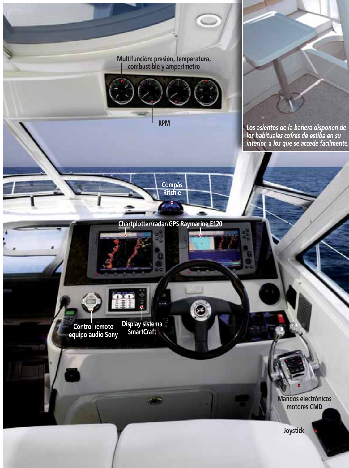
Multifunción: presión, temperatura, combustible y amperímetro