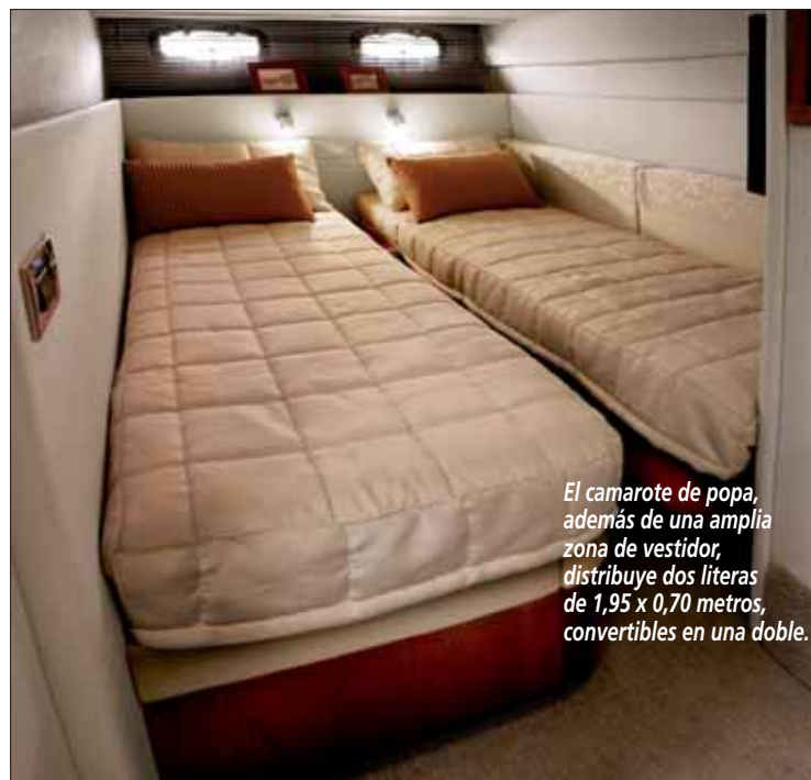
El camarote de popa, además de una amplia zona de vestidor, distribuye dos literas de 1,95 x 0,70 metros, convertibles en una doble.

Por otro lado, el área de descanso, con claro carácter acogedor, se ubica a proa y popa. La cabina de proa, destinada al armador, goza de