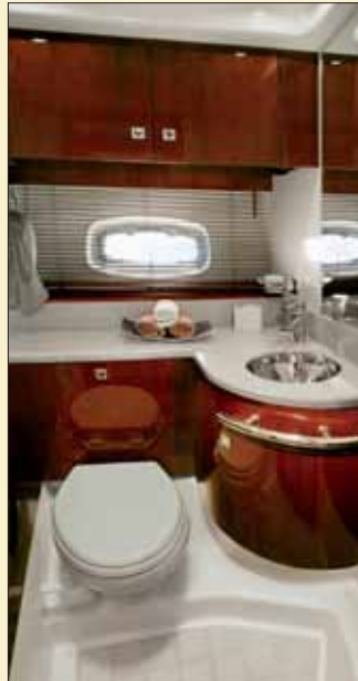
De uso exclusivo para los ocupantes del camarote de proa, se han instalado una cabina de ducha separada en el compartimento de estribor y, en el de babor, el aseo.