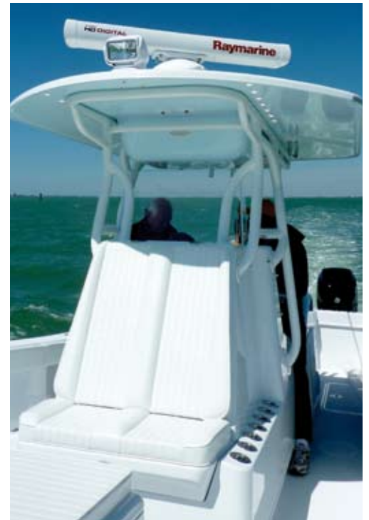
Existen distintas opciones para el hard top en este modelo. En este caso se ha optado por una estructura pintada en blanco