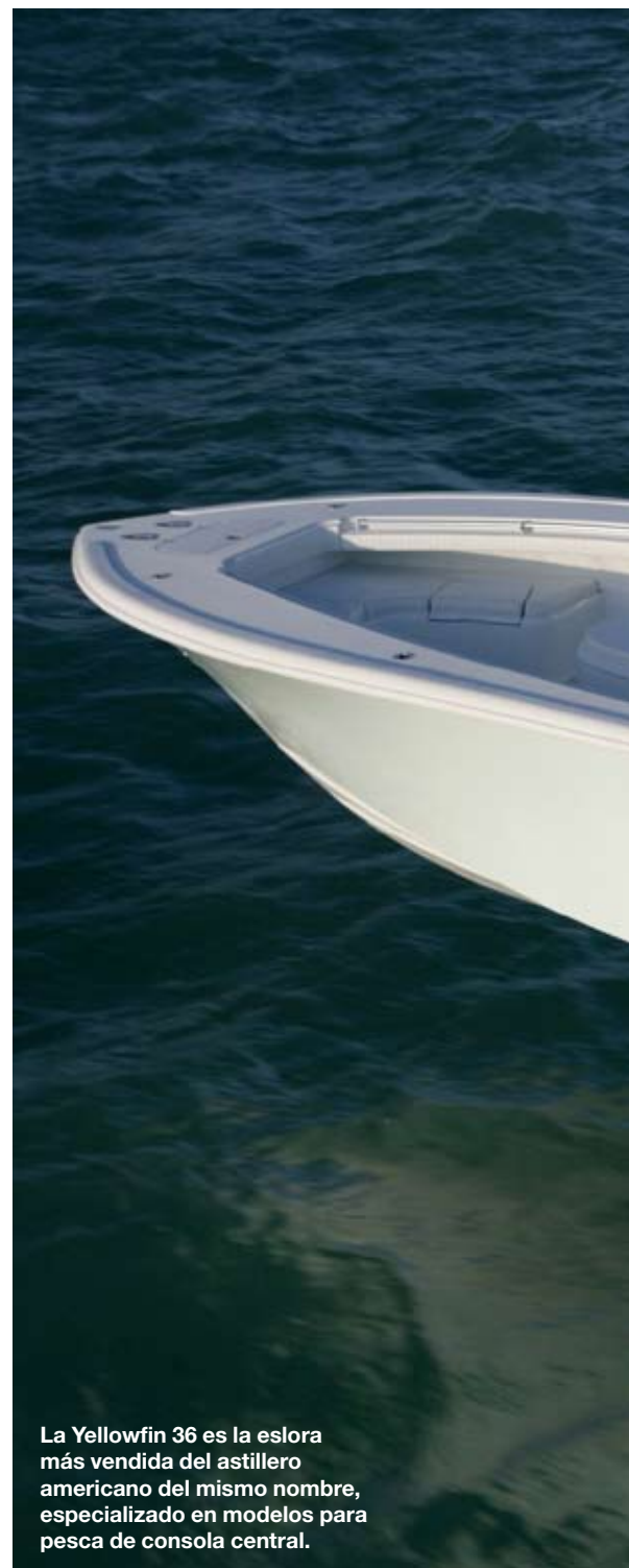
La Yellowfin 36 es la eslora más vendida del astillero americano del mismo nombre, especializado en modelos para pesca de consola central.