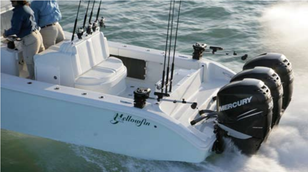
Con tres Varado de 300 Hp esta “purasangre” roza los 60 nudos de velocidad punta.

escalón transversal perfectamente “calibrado” en sus dimensiones, ya que su anchura se reduce progresivamente a medida que converge en la línea de crujía del barco, y esto le permite de obtener las mejores prestaciones de navegación, una gran facilidad en el planeo y gran agarre en al agua en los virajes con cualquiera de los conjuntos de potencia admitidos (aunque la Yellowfin 36 está homologada para instalar hasta 1.400 Hp).