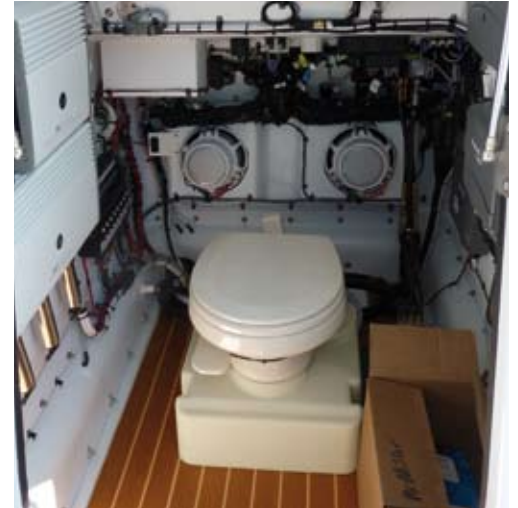
En este caso, se ha optado por instalar un inodoro en la consola central. Sin embargo, se aprecia la calidad y complicación de las instalaciones, y además en este caso con un equipo de música que ofrecía nada menos que 1.700 vatios de potencia en seis altavoces repartidos por la bañera.