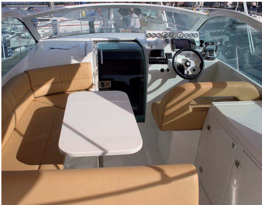
La bañera de esta unidad se compone de una cómoda dinette y un mueble auxiliar con cocina.

E n Baiona, participamos en la presentación de este nuevo modelo, el Starfisher Cancún 290, cuya buena acogida por parte de los aficionados ha propiciado que ya sean una veintena las unidades que se encuentran en el agua.