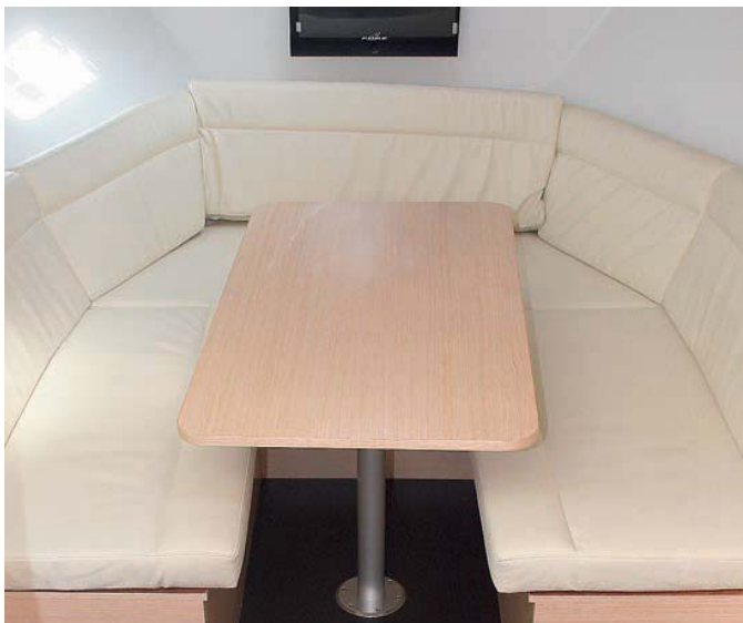
El salón es convertible en cama doble.

El comportamiento del barco en todo momento fue noble. Colocamos el trim en su nivel inferior, y una vez sobrepasadas las 3000 rpm de la velocidad de crucero, se asentaba, sin cabeceo alguno. Los viros, eran rápidos al igual que sus reacciones a los movimientos del volante, por lo que las maniobras se resuelven rápidamente. Pudimos efectuar la maniobra de atraque con el joystick de Axius y reducir considerablemente el número de maniobras para tal efecto. R. Solé