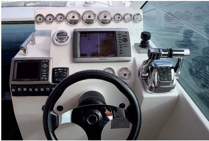
Los mandos y la palanca del motor son fácilmente accesibles.

en parte gracias a la amplitud de la plataforma de baño, que nos permite un gran radio de acción.