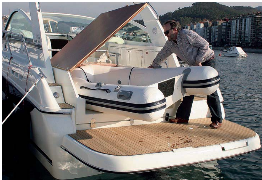
Una sola persona puede botar y estibar la neumática auxiliar.

Son sencillos, sin demasiadas concesiones a los detalles decorativos. Simplemente, prácticos. Tras descender tres escalones, nos encontramos en un salón, formado por un sofá que enmarca toda la parte de la proa, y una mesa desmontable, por lo que dicha zona también puede hacer función de cama doble. En la parte de proa va encajada en el mamparo una pantalla