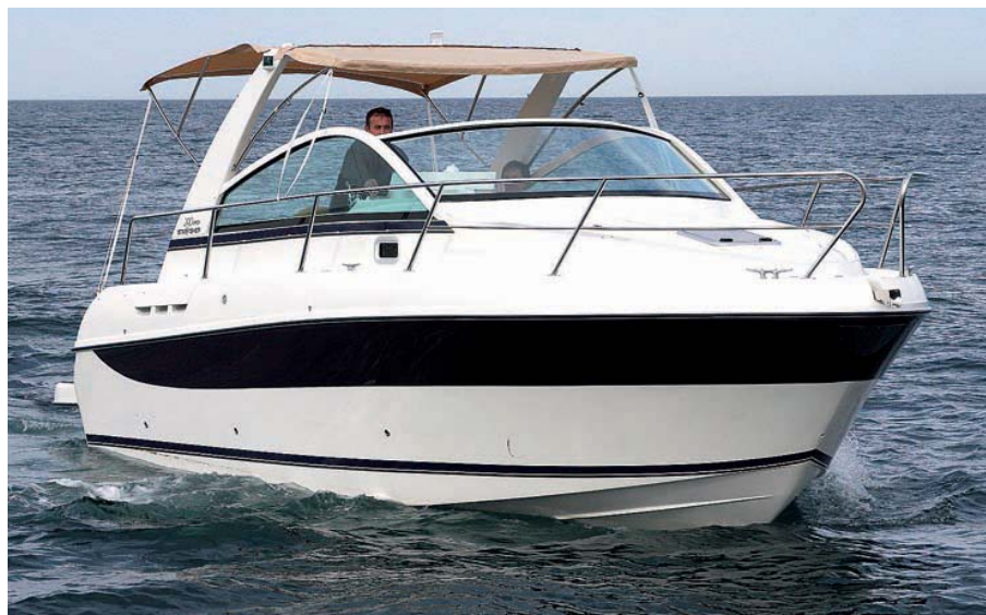
Un toldo de lona cubre toda la bañera, desde el puesto de mandos hasta el solárium.