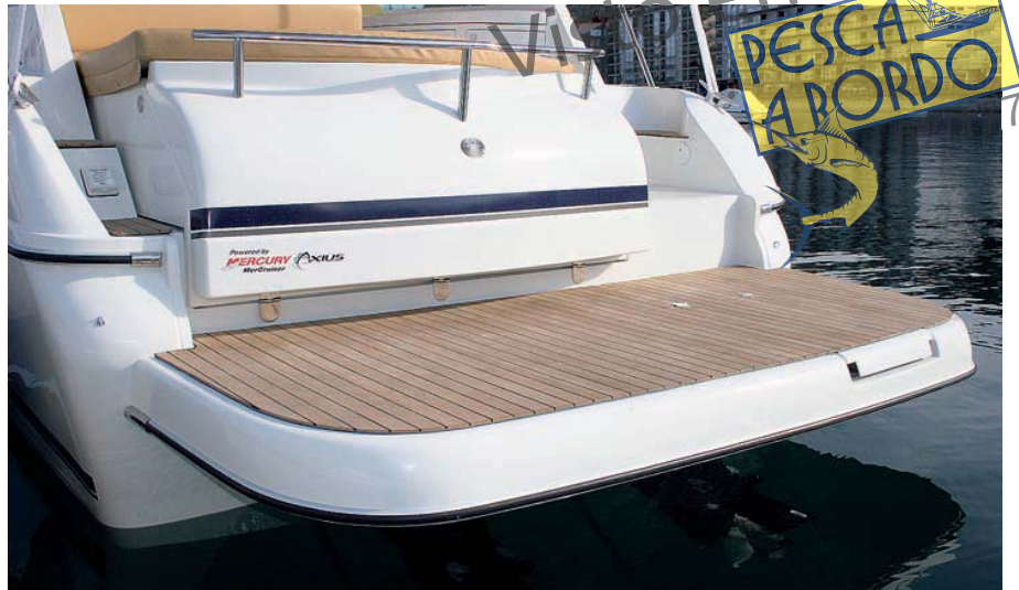
El barco Cancún 290 luce el distintivo de "Installation Quality".

de televisión y bajo los asientos del sofá hay amplios cajones para la estiba en los interiores. En la banda de babor, se ha instalado un armario con una nevera y un horno microondas, y en el lado opuesto, otro con el panel eléctrico, estantes y cajones varios. A continuación de éste, en una estancia separada hay un aseo con inodoro, lavabo y ducha.