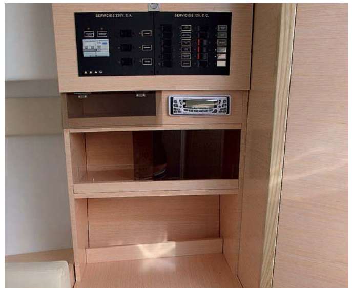
Abundante espacio de almacenaje.