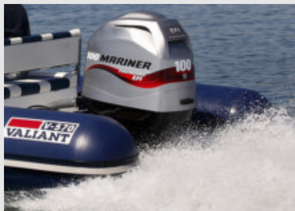
Con la motorización Mariner de 100 HP no hemos echado en falta más potencia

Esta unidad viene equipada de serie con dirección hidráulica que ofrece una gran maniobrabilidad