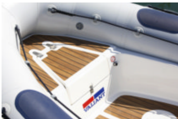
En proa cuenta con un volumen de guardado en el que cabe más que el fondo.