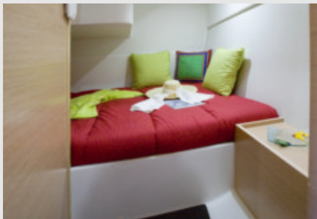
A popa, el camarote es transversal con una cama doble en un habitáculo de buena altura.

El camarote de popa es, también, uno de sus grandes atractivos. Tras haber visto ya muchas disposiciones similares, es decir, con cama doble dispuesta transversalmente, alabamos el razonable volumen que posee esta propuesta, cuya altura en la zona de entrada es de nada más y nada menos que de 1,90 m. Una pequeña repisa, la de un pequeño armario, actúa como mesilla de noche. Bajo la cama, más estiba con tapa de bisagra.