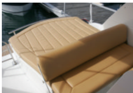
Abatiendo el respaldo se incrementa la superficie del solarío de popa.