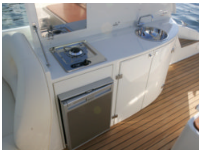
La cocina es exterior, práctica y grande para una 29 pies.