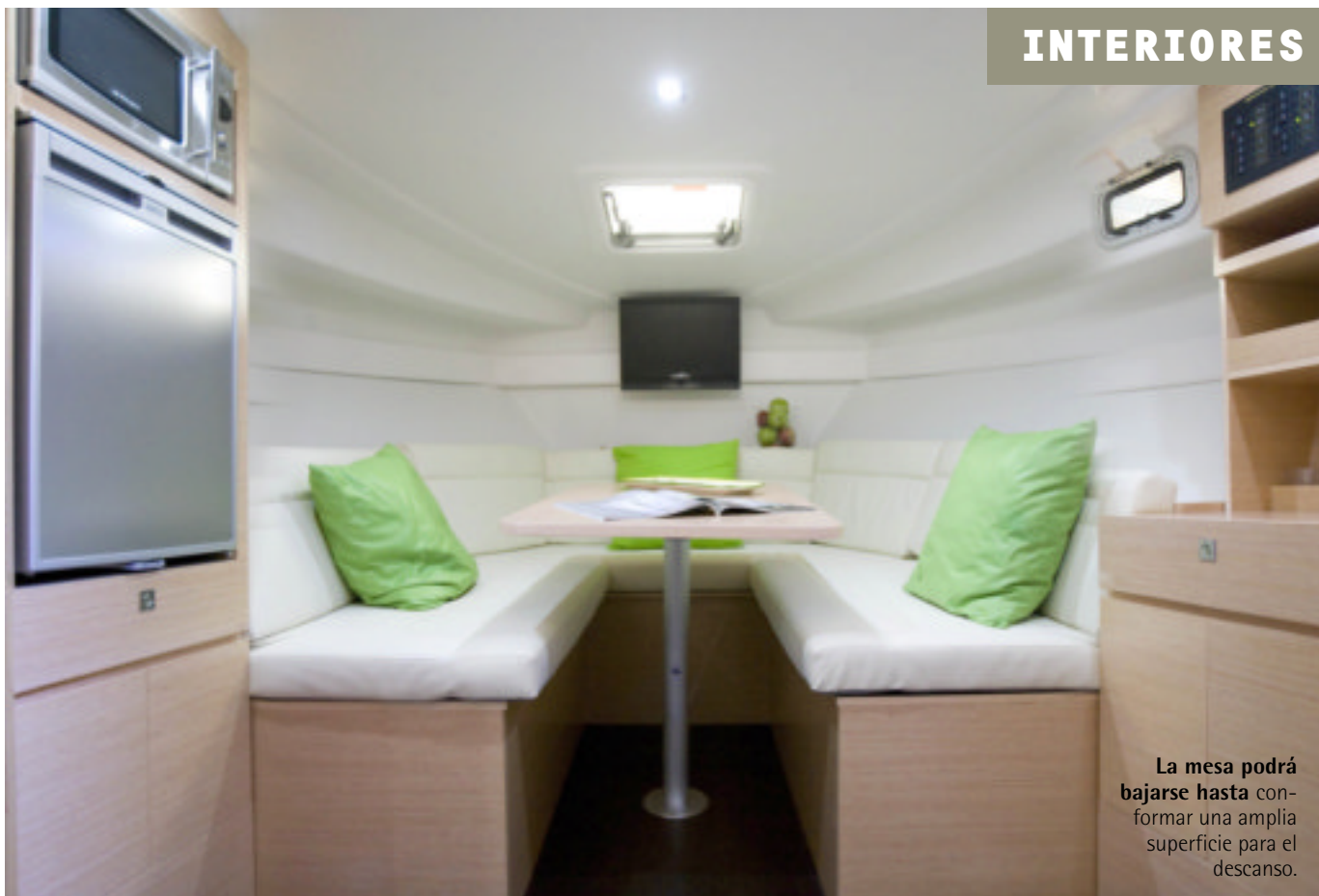
La mesa podrá bajarse hasta conformar una amplia superficie para el descanso.