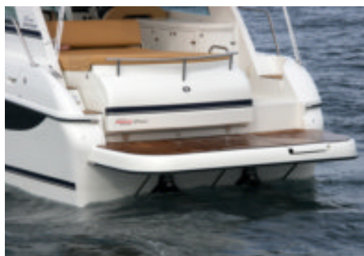
Plataforma muy amplia y elevada la de la Cancún 290.