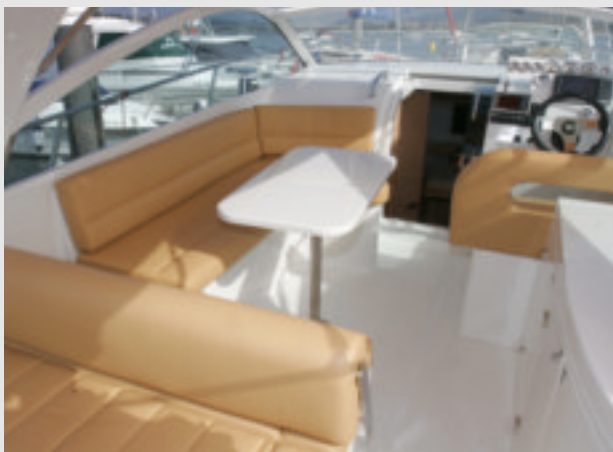
Esta 29 pies open ofrece espacio para la vida social.