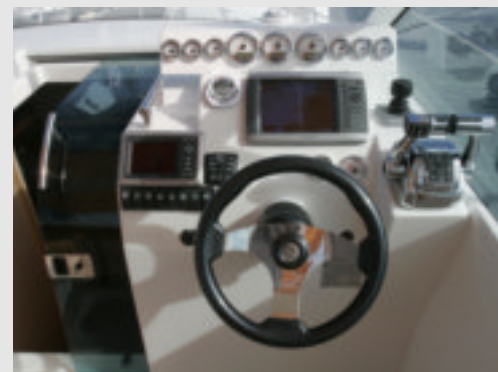
La unidad probada posee el sistema de gestión SmartCraft, el Joystic del Axius gama Premium y la informativa pantalla Vessel View.

S in arrufo en el cintón la Cancún 290 se muestra exteriormente robusta, moderna, actual y moderadamente deportiva. En la proa luce un balcón abierto para poder desembarcar con comodidad por este punto. El pozo del equipo de fondeo es grande, de una sola tapa y profundo. Posee un molinete de tiro lateral y las preceptivas y bien dimensionadas cornamusas a banda y banda. En las amuras, los guardamancebos son dobles y permitirán enganchar portadefensas a posteriori. De inmediato se alza