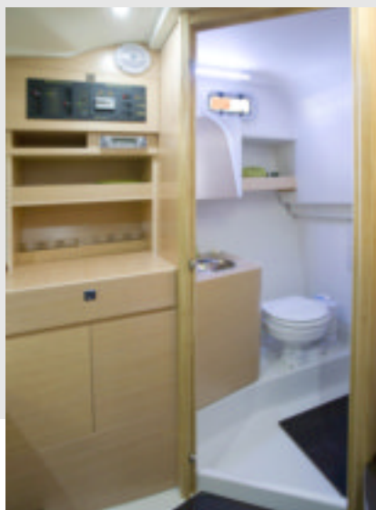
Una gran armario frente al de la nevera y microondas se encuentra cerca del amplio lavabo de Er.