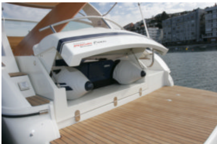
Práctica forma de llevar y conservar la auxiliar de los elementos.