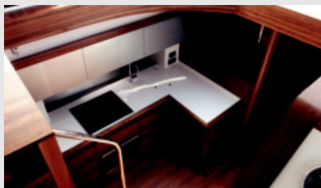
Cocina completa y abierta. La TV se orienta mediante un pivote hacia el salón.

A popa la cabina del armador instala una cama doble central, dos grandes armarios roperos y un lavabo de acceso privado. Cuenta con un "chaise longue" a Er. por debajo del nivel de los dos portillos que dan al exterior.