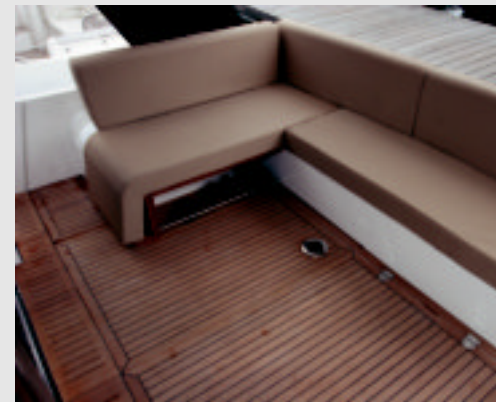
Bañera comedia para sentarse a la sombra del voladizo del fly cerca del agua y conversar.

E l F46 es la embarcación de mayor porte de la Serie F de Sea-line. Probablemente destaca por ofrecer unas proporciones inusuales entre eslora, francobordo y altura sobre la línea de flotación. A proa, tras el gran cofre del equipo de fondeo, su sobreestructura se alza de forma que, vista lateralmente, apenas se percibe hasta llegar al vértice del parabrisas. En dicha zona se halla el solarío con sus pasamanos en inox. Los pasillos laterales están forrados de teca y presentan una buena amplitud al paso entre el