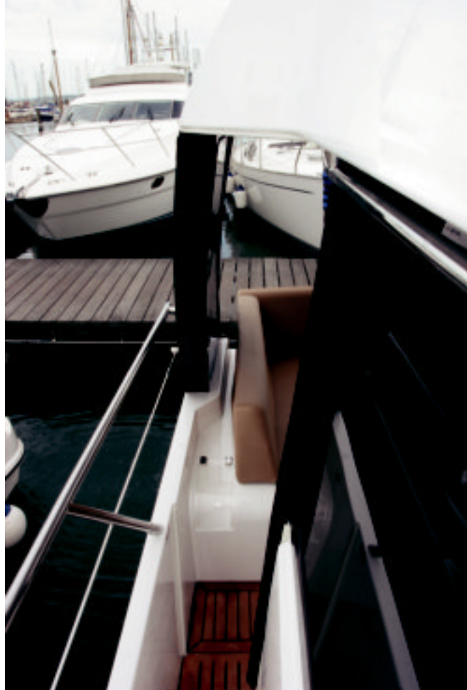
Llamativo tramo final de los pasillos laterales, como en los grandes barcos.