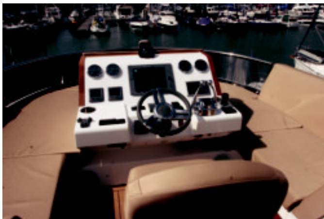
La consola central y los asiento envolventes en su entorno, un acierto.