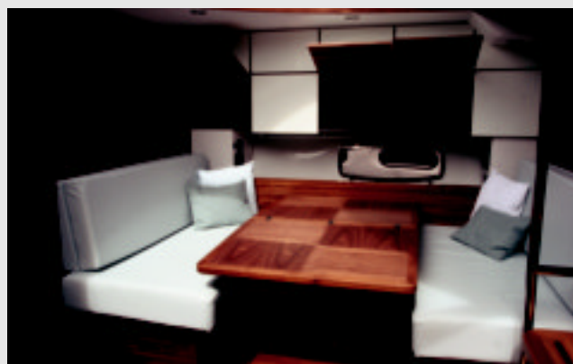
Salon estándar a Er. con posibilidad de "hacer" una cama más mediante la mesa de pie telescópico.