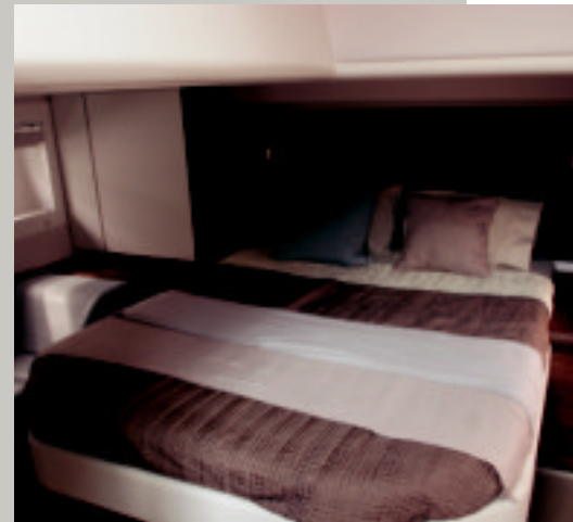
El camarote de popa ofrece una gran habitabilidad. Posee un "chaise longue" a estribor.

Barco singular que se aprende a apreciarlo conforme uno se va deteniendo en sus innumerables detalles, tanto en sus exteriores como en la gran calidad usada para la decoración y distribución de los interiores. Barco poco convencional en que prima la confortabilidad en la habitabilidad que, dadas sus características, dotación y su buen volumen interior, puede permitir una vida a bordo de larga duración. Ofrece un ambiente sobrio que algunos podrían calificar de "lujo contenido", especialmente desde el punto de vista mediterráneo. Y desde este punto de vista, debe admitirse que su diseño está ligeramente más enfocado al mediterráneo ya que ahora, disponer sombra en la bañera habiendo un gran solarío a proa y en el flybridge puede considerarse una ventaja.