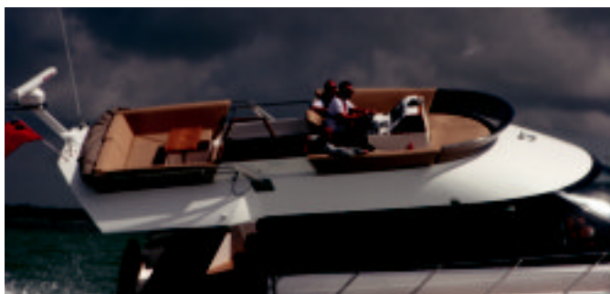
Existe espacio suficiente para holgazanear y sentarse a la mesa de tertulia.