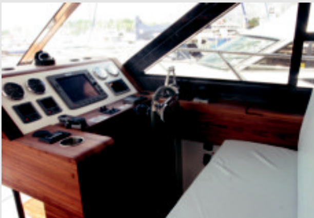
Puesto de mando austero, con mucha visibilidad y elevallas lateral eléctrico.

La transmisión Zeus permite que el barco sea más sensible y maniobrable.