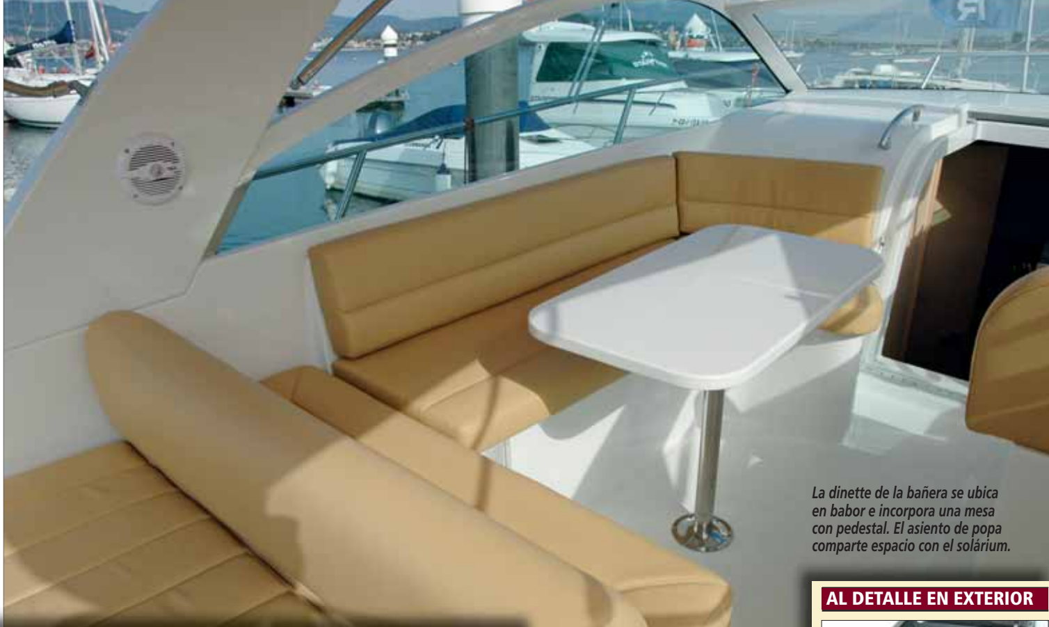
La dinette de la bañera se ubica en babor e incorpora una mesa con pedestal. El asiento de popa comparte espacio con el solárium.