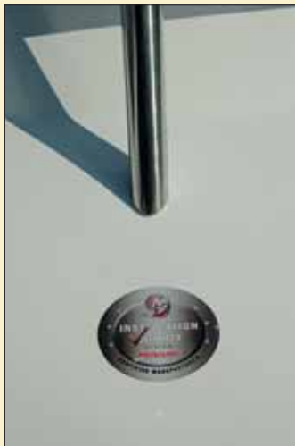
Éste es el logo que Touron entrega como Certificación IQ en la instalación de motores Mercury MerCruiser.