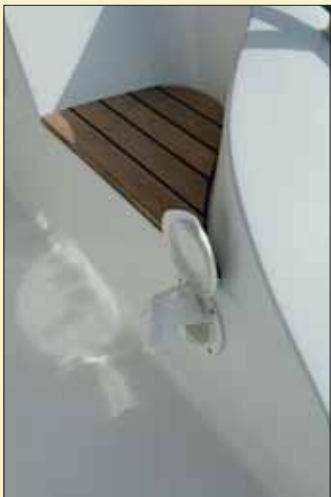
La ducha de la bañera se encuentra en su alojamiento específico, cerca de la plataforma de baño.