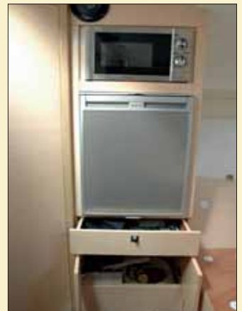
En babor hay otro mueble con la nevera, el microondas y cajones y armarios inferiores.

en babor cuyo respaldo de popa puede moverse proa-popa según nos convenga utilizarlo para el solárium o para el asiento. En estribor se ha dispuesto un wet bar al que se le puede acoplar un quemador, fregadero y nevera, además de contar con armarios bajos. A proa de este mueble está el puesto de gobierno con un asiento doble, sin reposapiés, frente a una consola de gobierno que escamotea tras ella la puerta de entrada al interior. Aunque el ancho de paso de los pasillos laterales es suficiente, éstos no cuentan con ningún francobordo exterior que ayude a asegurar el tránsito. En la parte superior de la cabina, en cubierta, puede instalarse un solárium acolchado que el astillero ofrece en opción y, finalmente, llegaremos a la maniobra de fondeo de proa, que incluye un pozo de anclas, molinete (opcional) y la puntera con roldana en inox.