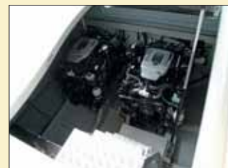
La cámara de motores está debidamente insonorizada y el acceso se encuentra bajo el garaje.