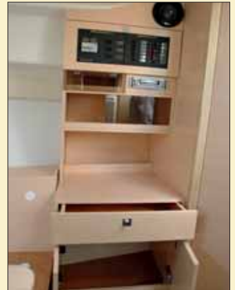
El mueble de estribor cuenta con el cuadro eléctrico, armarios correderos y cajones inferiores.