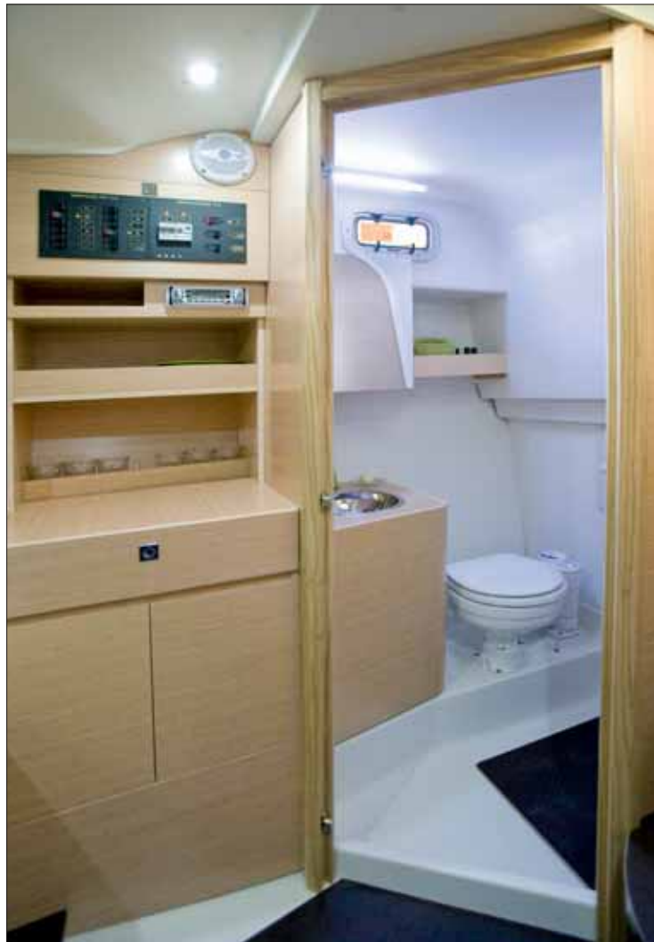
▲ El aseo cumple su misión, con inodoro, lavamanos de acero inoxidable y ducha extensible alojada en un registro en la pared.

El concepto day cruiser viene marcado por la ausencia de cocina en el interior, así como por su distribución, cuyo suelo está forrado en madera de wenge y, el mobiliario, en roble mallado. En popa, el salón en V podrá convertirse en una cama doble, con ambos armarios →