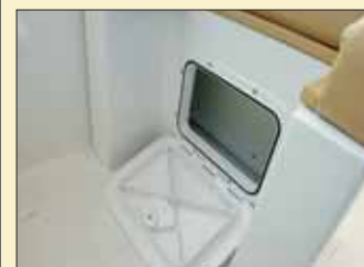
Se ha añadido un registro adicional bajo el asiento de pilotaje.