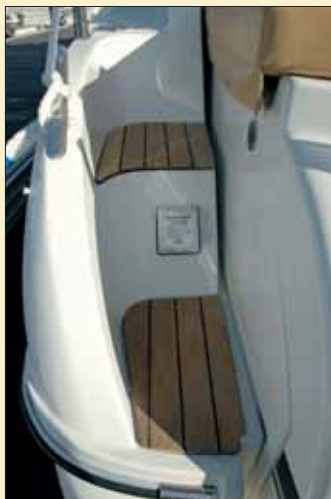
Entre los peldaños de acceso al pasillo de babor se sitúa la toma de tierra de 220 voltios.