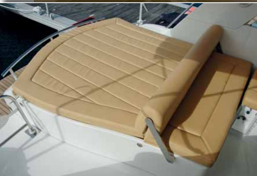
▲ El rulo de la cabecera del solárium acolchado de popa de serie puede invertir su posición para actuar como respaldo del asiento. ▼