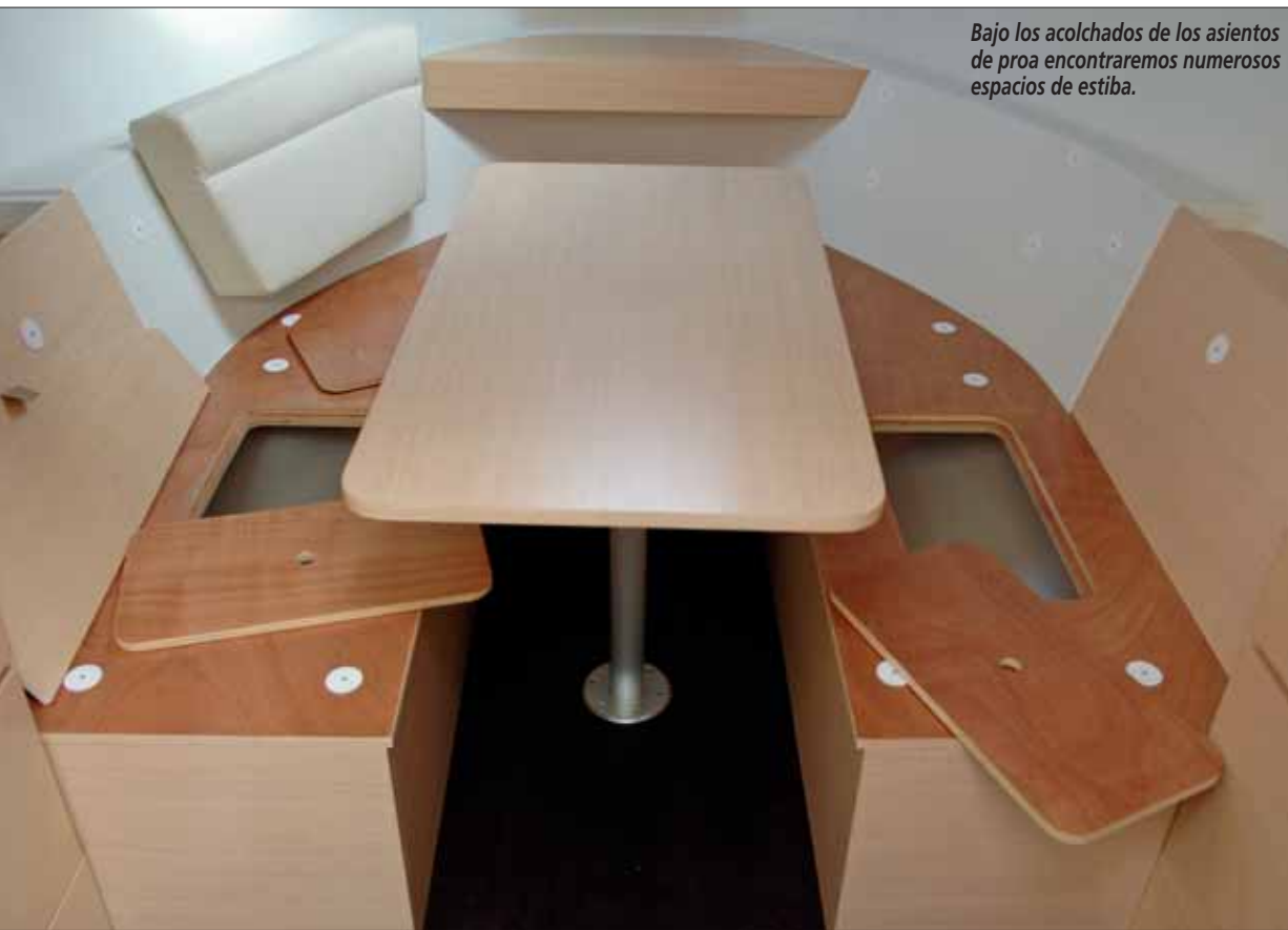
Bajo los acolchados de los asientos de proa encontraremos numerosos espacios de estiba.

●●● En popa dispondremos de un gran camarote con una cama doble que, AL LEVANTAR EL SOMIER SUJETADO POR PISTONES MANUALES , descubre un muy agradecido espacio de estiba adicional