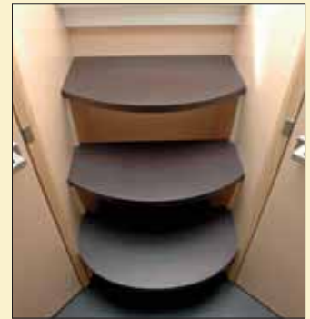
Deberemos bajar tres escalones de wenge para entrar en el salón interior.