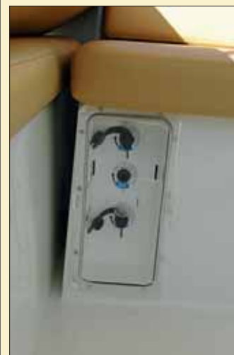
Los desconectores de baterías se alojan en un registro frontal bajo los asientos de la dinette.