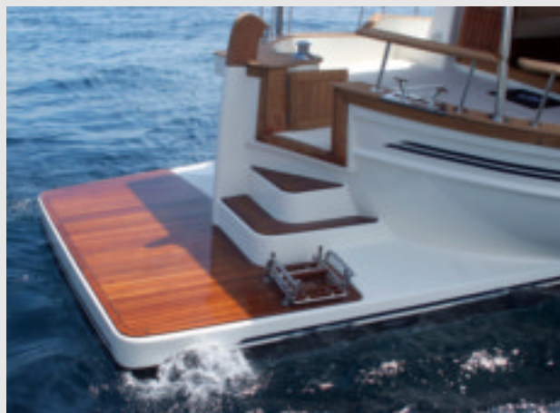
La amplia plataforma de popa actúa como un flap integrado.