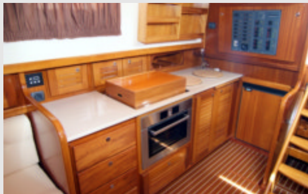
La cocina es amplia y está bien equipada.