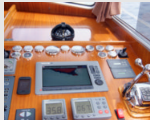
Desde el asiento del piloto tenemos muy buena visibilidad. La consola está muy bien dotada de instrumental.

Desde hace más de treinta años, el astillero Menorquín construye embarcaciones con diseños inspirados en el legendario llaüt mediterráneo. Desde sus primeros yates la marca ha evolucionado constantemente; y su última presentación: el Menorquín 160, resulta un auténtico crucero de altura cómodo y seguro, que mantiene el inconfundible perfil tradicional que les caracteriza.