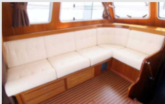
La zona social dispone de un sofá en "L" de 6 plazas convertible en cama.

En todo el espacio disponible bajo cubierta abundan los armarios, cajones y cofres en donde estibar los enseres. Dispone de estratégicos asideros que nos dan seguridad.