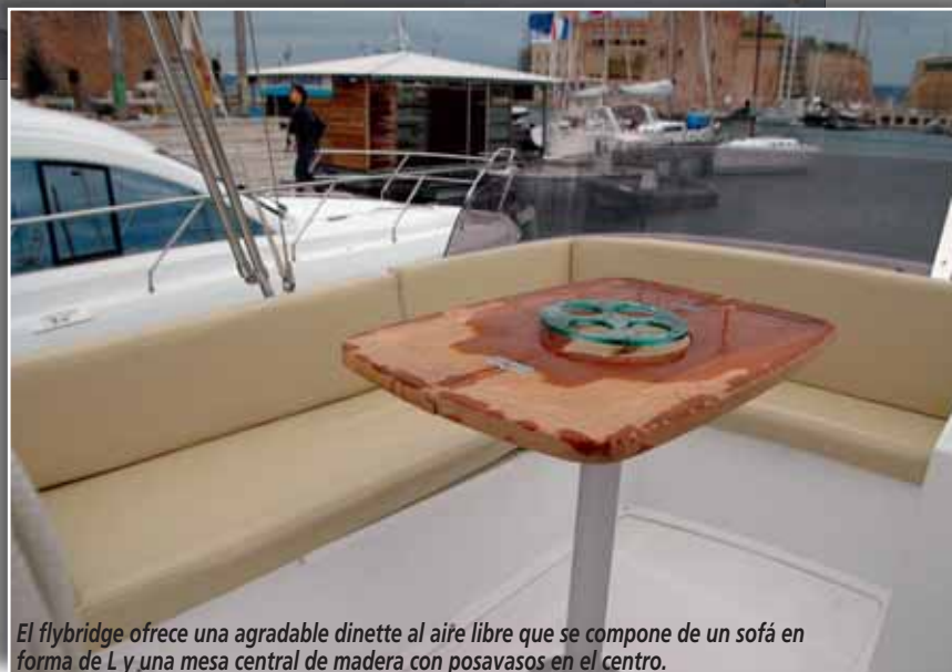
El flybridge ofrece una agradable dinette al aire libre que se compone de un sofá en forma de L y una mesa central de madera con posavasos en el centro.

Los espacios habitables exteriores destacan por su seguridad, empezando desde la mismísima plataforma de baño integrada, forrada en teca para evitar resbalones y dotada de una escalera de baño plegable que podría incluir algún sistema para escamotearla mientras no esté en uso. Desde ella, una portezuela nos da la bienvenida a