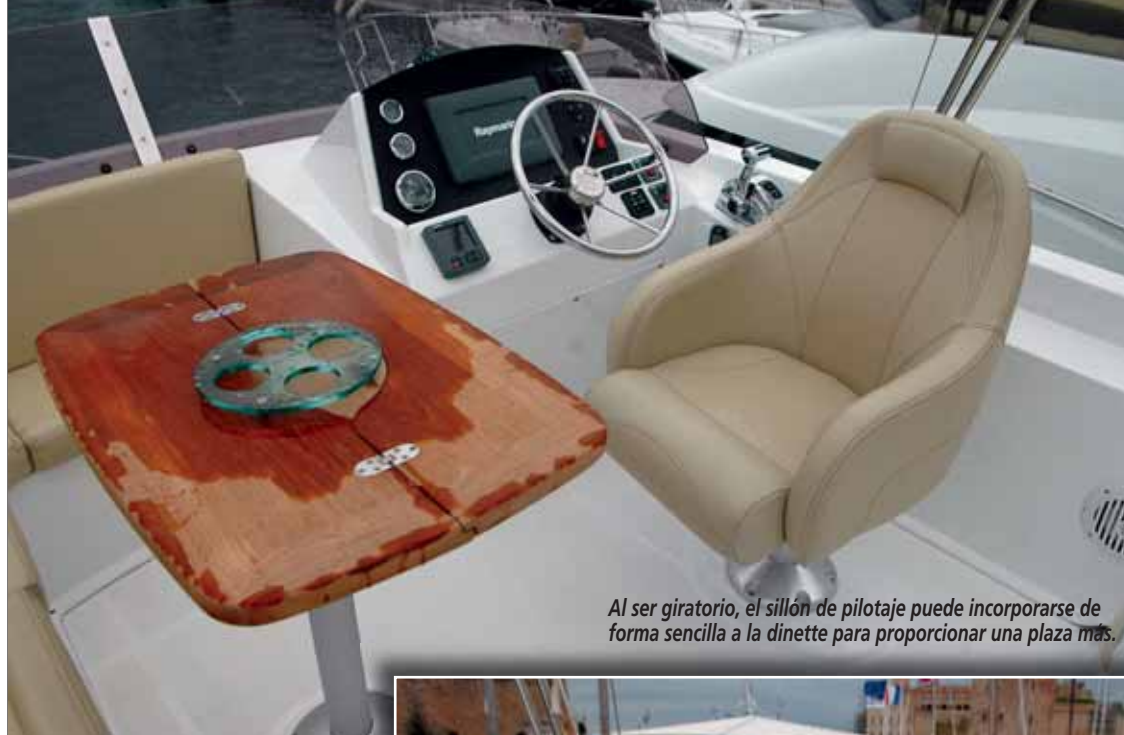
Al ser giratorio, el sillón de pilotaje puede incorporarse de forma sencilla a la dinette para proporcionar una plaza más.

La sección trasera del flybridge se presenta totalmente despejada, en previsión de la estiba de la lancha auxiliar o la disposición de un solárium improvisado. ▼