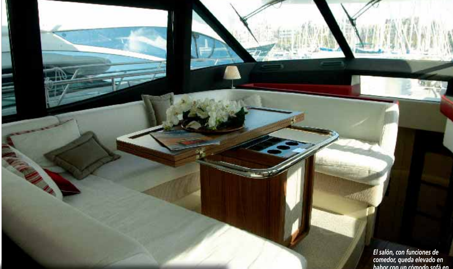
El salón, con funciones de comedor, queda elevado en babor con un cómodo sofá en forma de C y una mesa con una ala plegable en el centro.