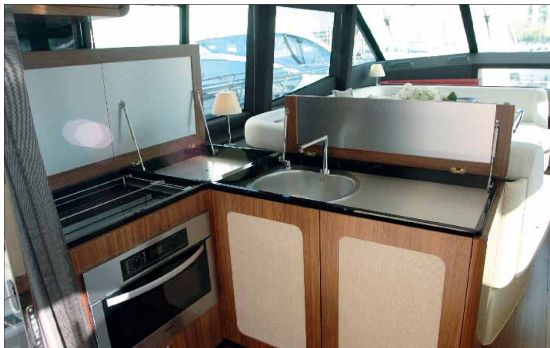
La cocina se ha situado en una zona ▶ intermedia entre la bañera y el salón, y se ha equipado con vitrocerámica, un fregadero de acero inoxidable y una gran capacidad de estiba.

El salón-comedor se eleva ligeramente en babor, proporcionando un cómodo sofá en forma de U y