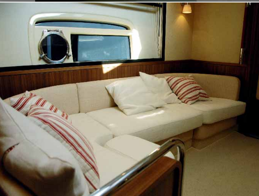
▲ La distribución de la unidad que probamos nos daba la bienvenida a la cubierta inferior con un segundo salón más íntimo, amueblado con un cómodo sofá.

La bañera también da paso al fly-bridge a través de una escalera. Este tercer ambiente exterior dispone de una generosa dinette con una mesa ampliable, un módulo de cocina con fregadero, vitrocerámica y máquina de hielo, y un segundo puente de mando en la sección de estribor de la proa, equipado con un sillón de pilotaje individual de diseño ergonómico. La parte trasera se presenta despejada para la estiba de la balsa salvavidas y en ella sobresale una robusta torre de radar que, además de dar soporte a las antenas, incorpora una ducha, los altavoces y un espacio de almacenamiento en su base.