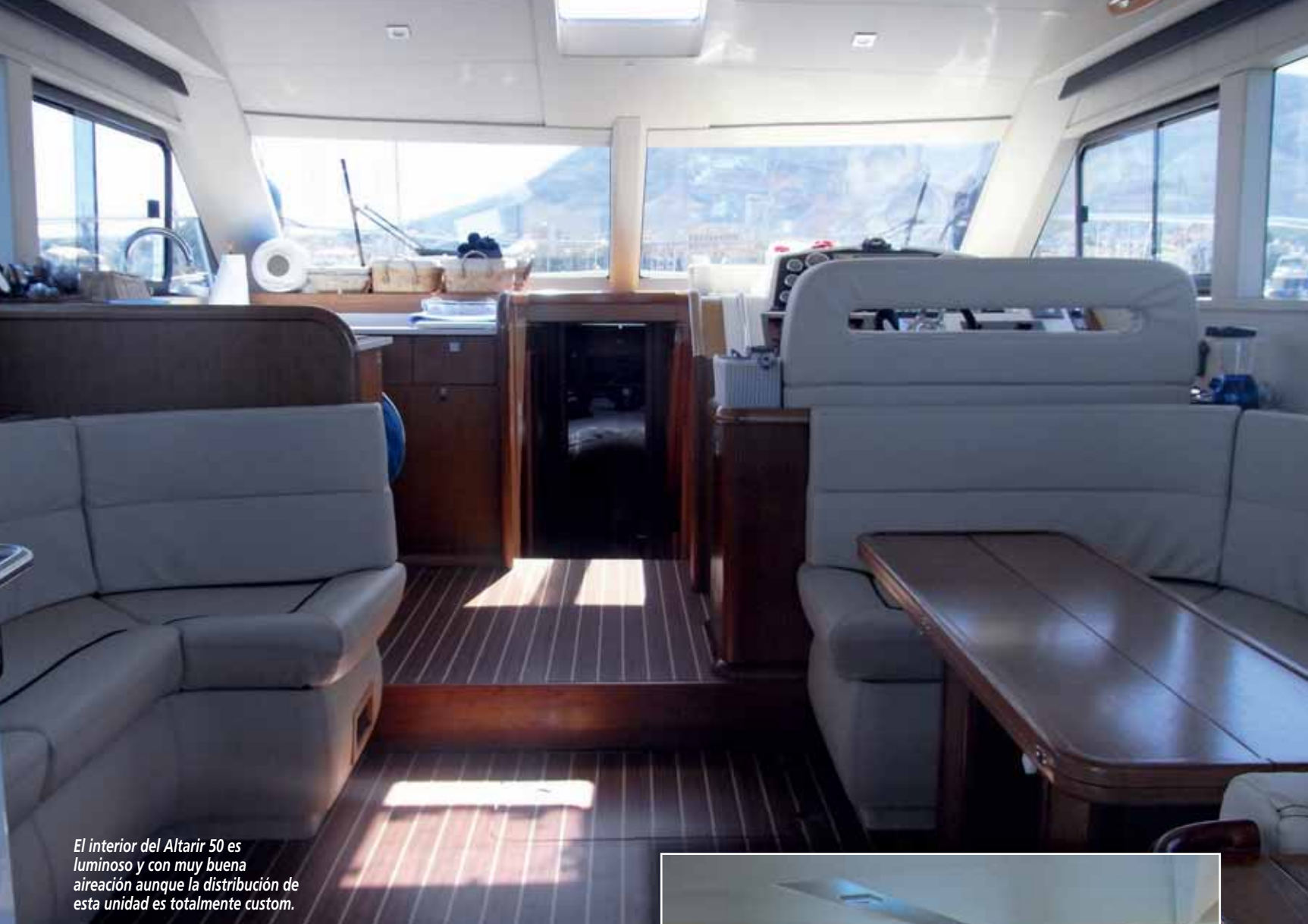
El interior del Altair 50 es luminoso y con muy buena aireación aunque la distribución de esta unidad es totalmente custom.

quedar plegados adosados al alto francobordo de casi 70 centímetros. Como hemos indicado, toda la bañera está forrada en teca y cuenta con tres registros; dos de ellos –los más exteriores– están destinados exclusivamente a estiba y el central da acceso al camarote de marinería, que alberga dos literas. Curiosamente, a estribor de la puerta de acceso al interior se ha instalado un módulo con fregadero, lavavajillas inferior y un asiento a estribor. Los pasillos laterales son de un ancho notable (32 centímetros) y con un francobordo de seguridad de 10 centímetros de alto. El primer escalón en ambos pasillos se ha destinado también a estiba y el paso por éstos es cómodo y seguro gracias a la altura de los candeleros sobre la regala y al pasamanos inicial situado en el lateral exterior del fly. En proa se ha instalado un gran solárium acolchado sobre la caseta y que está flanqueado por sendos pasamanos de acero inoxidable. Ya en