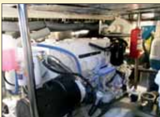
La cámara de motores, donde se hallan los dos Cummins QSM 11, está perfectamente insonorizada.

De este modo, justo a la entrada del salón en babor se halla un sofá en L con mueble auxiliar a popa y otro sofá en U en estribor con mesa central. En un segundo nivel, más a proa, tenemos el puesto de gobierno a estribor frente a un asiento de dos plazas y, en la banda contraria, se encuentra la cocina, algo pequeña pero con todos los elementos imprescindibles, incluyendo el fregadero de un seno y placas de cocción vitrocerámicas. Bajaremos a la zona de camarotes, cuya distribución cuenta con dos cabinas con literas, el aseo completo con ducha independiente y una curiosa conformación del camarote de proa con dos camas en V.