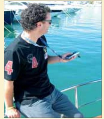
Esta unidad incorporaba de serie el sistema Yacht Controller para facilitar las maniobras de atraque y desatraque del barco.