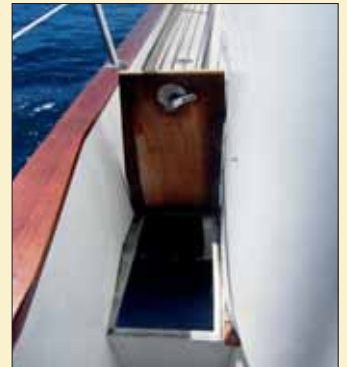
Bajo el escalón de los pasillos laterales también hallamos espacio de estiba.