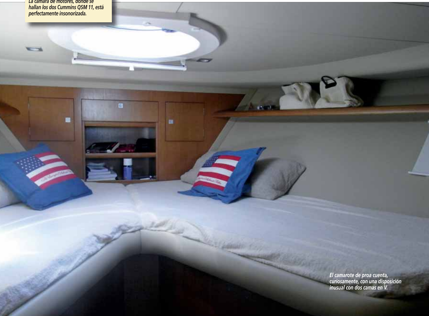
El camarote de proa cuenta, curiosamente, con una disposición inusual con dos camas en V.

●●● Bajaremos a la zona de camarotes, cuya distribución cuenta con dos cabinas con literas, el aseo completo con ducha independiente y UNA CURIOSA CONFORMACIÓN DEL CAMAROTE DE PROA CON DOS CAMAS EN V