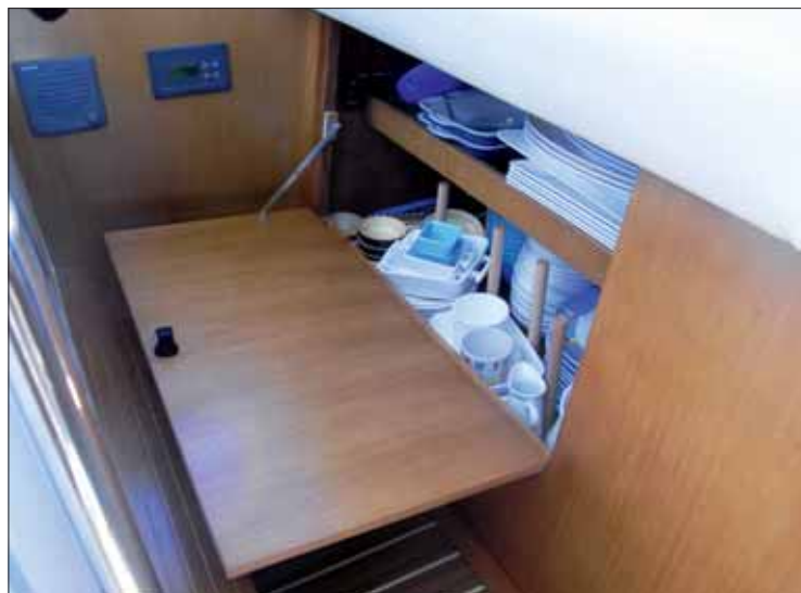
▲ La capacidad de estiba en la cocina es muy buena, como refleja este armario bajo para la cubertería.

Dirección algo dura y distribución interior de esta unidad