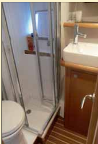
El baño es eminentemente funcional e incluye ducha independiente.