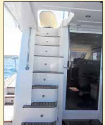
La escalera de acceso al fly es de PRFV pero con los escalones forrados en teca.