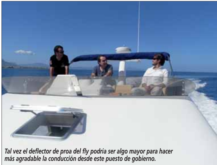
Tal vez el deflector de proa del fly podría ser algo mayor para hacer más agradable la conducción desde este puesto de gobierno.

●●● Aunque parece más bien un barco de concepto fisher, LO CIERTO ES QUE LA DISTRIBUCIÓN EXTERIOR CUMPLE CON TODOS LOS REQUISITOS DE UN CRUCERO , lo que lo convierte en un ejemplo de polivalencia de uso