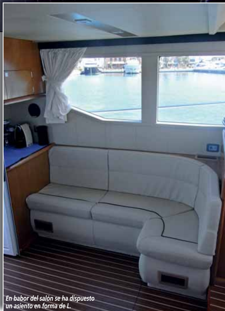
En babor del salón se ha dispuesto un asiento en forma de L.

No podemos fijarnos con sentido crítico en la decoración, materiales ni distribución interior puesto que, como recordaremos, se trata de una embarcación cien por cien custom. En ella, se ha huido de las formas armoniosas y estéticas en pos de la practicidad para el armador. →