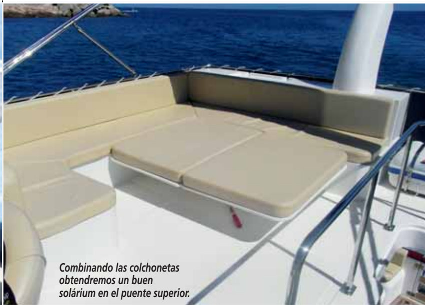
Combinando las colchonetas obtendremos un buen solárium en el puente superior.

●●● Aunque parece más bien un barco de concepto fisher, LO CIERTO ES QUE LA DISTRIBUCIÓN EXTERIOR CUMPLE CON TODOS LOS REQUISITOS DE UN CRUCERO , lo que lo convierte en un ejemplo de polivalencia de uso