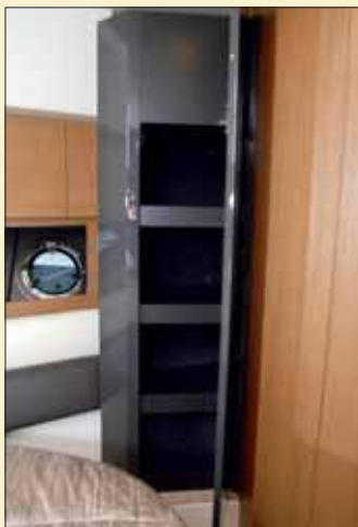
La cabina de invitados cuenta también con varios espacios más de estiba, como este armario en el que se ha optado por las estanterías.

●●● Ocupando la manga entera de la sección central se ha situado el camarote del armador, AMPLIO Y LUMINOSO GRACIAS A LAS GENEROSAS VENTANAS que se han instalado a ambos lados