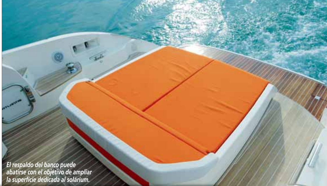
El respaldo del banco puede abatirse con el objetivo de ampliar la superficie dedicada al solárium.