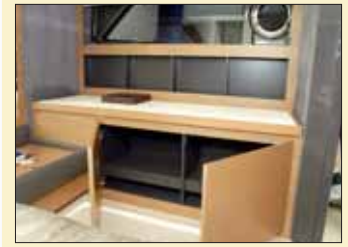
Un mueble bajo ocupa el lateral de babor de la cabina del propietario, aumentando la capacidad de estiba de la zona mediante un armario doble.