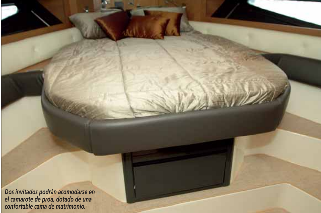
Dos invitados podrán acomodarse en el camarote de proa, dotado de una confortable cama de matrimonio.

dispone un fregadero de acero inoxidable, una vitrocerámica de cuatro quemadores, un horno-microondas, nevera y una buena cantidad de armarios y cajones para guardar todos los utensilios necesarios.