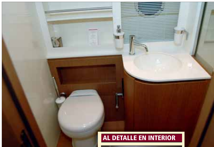
▲ La cabina del armador cuenta con su propio aseo privado equipado con un inodoro y un lavabo de diseño moderno.

El salón-comedor, a estribor de la entrada, proporciona un cómodo sofá de cinco plazas en forma de C y una mesa con alas plegables que podrán convertirse en cama doble de forma opcional. El área cuenta con la proximidad de la cocina, que →