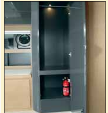
Dos armarios de buena altura permitirán colgar la ropa y facilitarán el orden en la estancia.