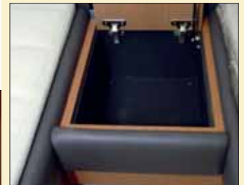
Para la mesilla de noche de babor se ha optado por una apertura superior, lo que ofrece un acceso más sencillo y un volumen interior más amplio.