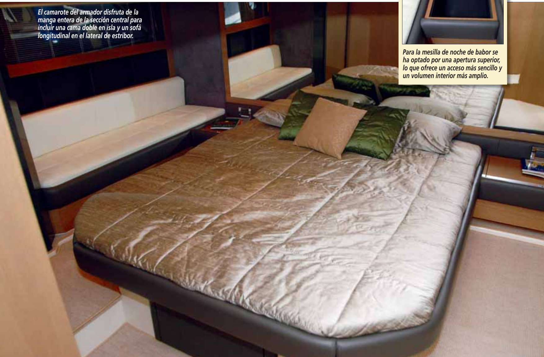
El camarote del armador disfruta de la manga entera de la sección central para incluir una cama doble en isla y un sofá longitudinal en el lateral de estribor.