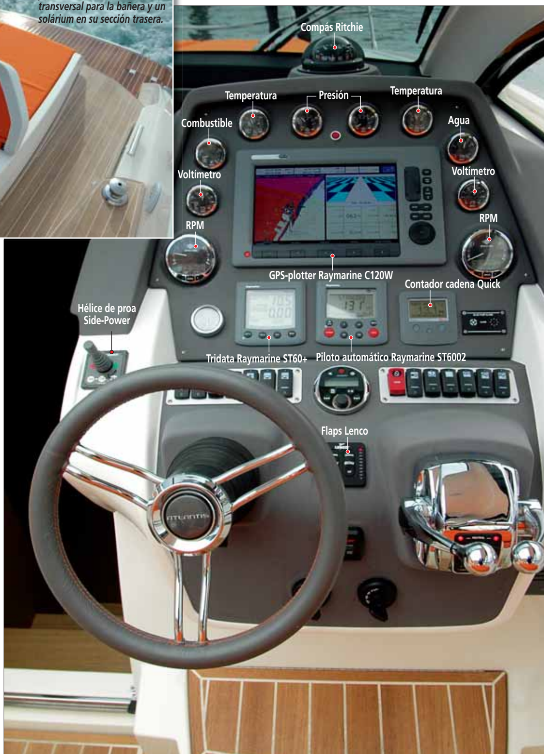
Hélice de proa Side-Power

En el exterior, la primera característica que apreciamos es el desarrollo de la cubierta principal en un mismo nivel, incluyendo la bañera y una generosa plataforma de baño forrada en teca que, en la unidad probada, se trataba de la versión hidráulica opcional, lo que facilita el lanzamiento de una lancha auxiliar o una moto acuática liberando a la bañera de la necesidad de incluir un garaje, beneficiando de este modo a la capacidad de estiba en general. En cualquier caso, la zona incorpora también una escalera de baño telescópica de acero inoxidable en babor y una ducha de agua fría y caliente, y conduce a la bañera a través de los pasillos liberados a ambos lados del primero de los solárium que encontramos a bordo.