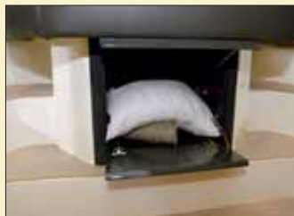
Un compartimento situado al pie de la cama del camarote de proa permitirá guardar algunos de los accesorios necesarios.