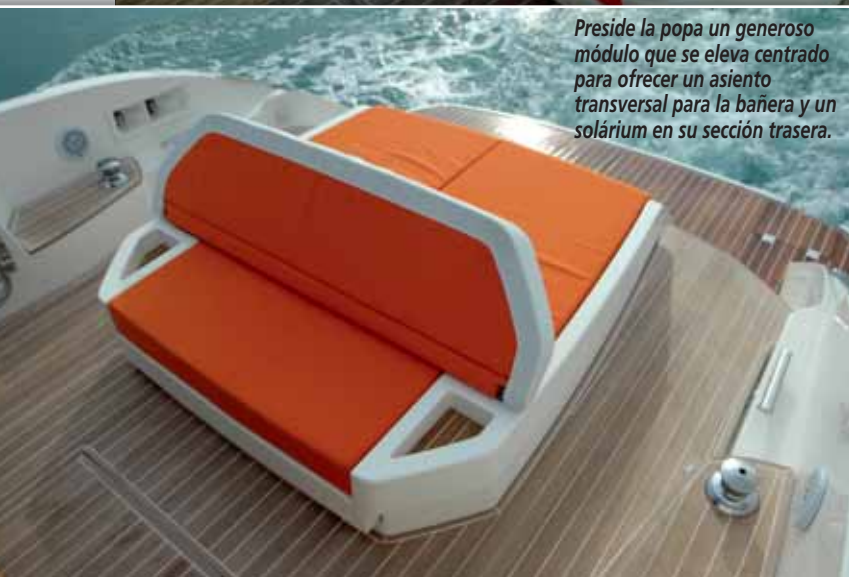
Preside la popa un generoso módulo que se eleva centrado para ofrecer un asiento transversal para la bañera y un solárium en su sección trasera.

●●● LA PRIMERA CARACTERÍSTICA QUE APRECIAMOS ES EL DESARROLLO DE LA CUBIERTA PRINCIPAL EN UN MISMO NIVEL, incluyendo la bañera y una generosa plataforma de baño forrada en teca que, en la unidad probada, se trataba de la versión hidráulica opcional