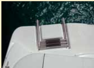
La escalera de baño de acero inoxidable va instalada sobre la plataforma en estribor.

●●● Iniciamos nuestra navegación COMPROBANDO LA EXCELENTE EFECTIVIDAD DEL CASCO, UN MUY BUEN CASCO, EXENTO DE CAVITACIÓN ALGUNA y con un agarre excepcional en los giros arriesgados