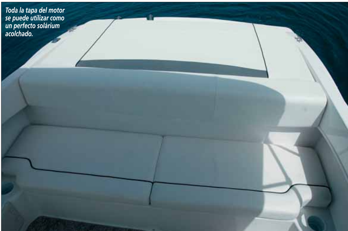
Toda la tapa del motor se puede utilizar como un perfecto solárium acolchado.

Las dos bañera están forradas con moqueta, rematada la de popa por un asiento transversal con buena estiba en su interior. Si queremos fondear y tomar el sol, la tapa del motor nos ayudará a ello, puesto que el acolchado superior se puede utilizar como solárium. En el extremo de popa, la plataforma de baño integrada cuenta con un gancho de esquí central y con la escalera de baño de acero inoxidable instalada en estribor. ■