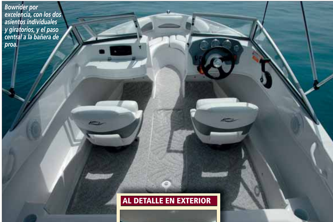
Bowrider por excelencia, con los dos asientos individuales y giratorios, y el paso central a la bañera de proa.

asas a cada una de las bandas para los tripulantes de proa, que, por otra parte, podrán encontrar estiba bajo los asientos. Debido a su tamaño, la embarcación no incluye la típica portezuela central, pero sí cuenta con el parabrisas central abatible para facilitar el paso entre ambas bañeras. El puesto de gobierno en estribor dispone de una perfecta visibilidad tanto del entorno como de la relojería del motor, contando con un asiento individual y giratorio. Este asiento se duplica para el copiloto, en babor, que dispondrá frente a él de una pequeña consola que alberga la radio CD, una toma de 12 voltios tipo mechero y una guantera con tapa. A ambos lados exteriores de piloto y copiloto, la embarcación cuenta con unas guanteras longitudinales a ras de suelo y entre ambos asientos se halla el típico cofre central para estibar el equipo de esquí.