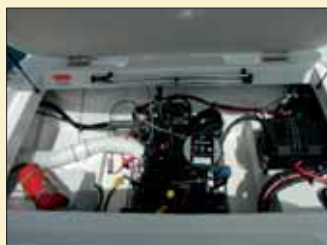
Bajo el solárium se esconde un potente motor de 135 CV gasolina perfectamente insonorizado.