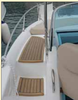
La distribución de cubierta sólo prevé un pasillo lateral a babor para acceder a la zona de proa.