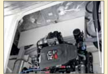
Para realizar el mantenimiento y las reparaciones gozaremos de un extraordinario acceso a los motores.

drá utilizarse tanto en el sentido de la marcha como en el contrario, mientras que, si desplazamos el respaldo hacia atrás, obtendremos un espacioso solárium. En su interior, que alcanzaremos mediante un sistema de pistones de gas, encontraremos un gran espacio de estiba con capacidad suficiente para una embarcación auxiliar, así como una segunda tapa, también