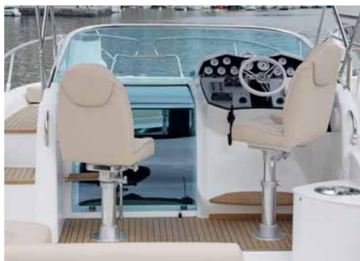
▲ Los asientos del piloto y copiloto son regulables en altura y en el sentido proa-popa.

tanto en altura como en el sentido proa-popa, la visibilidad era excelente y, gracias a la protección del parabrisas, la navegación a velocidad de crucero resultó muy cómoda.