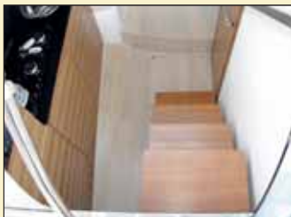
Cuatro peldaños de madera nos darán acceso al interior.