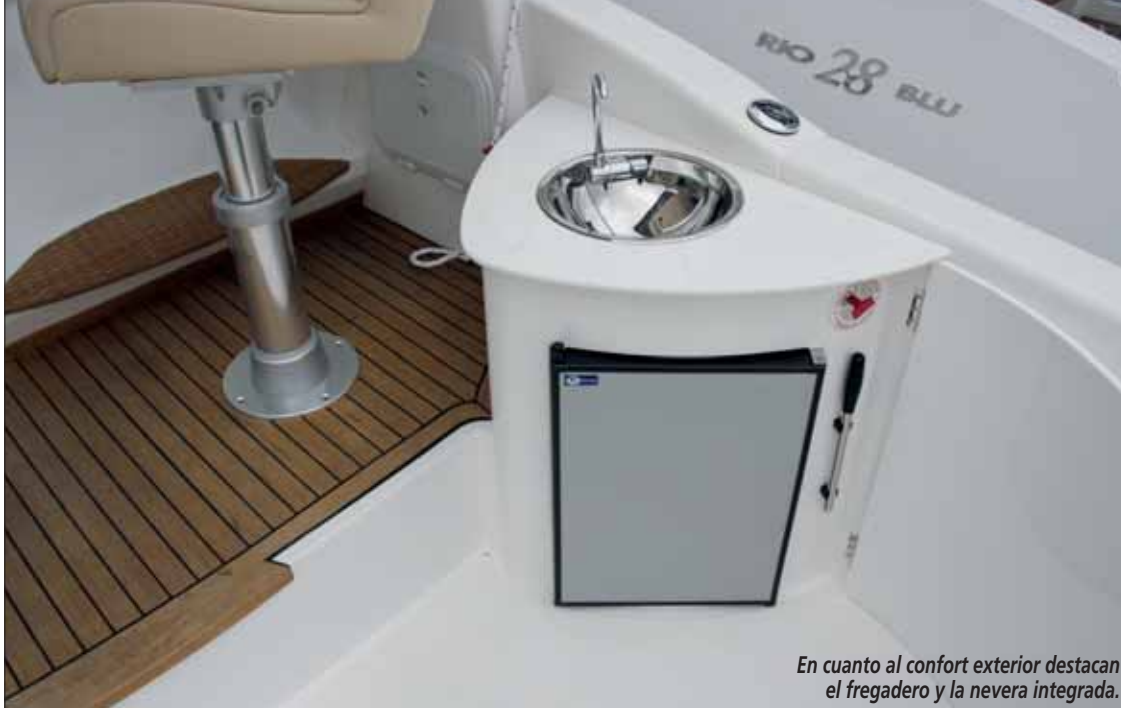
En cuanto al confort exterior destacan el fregadero y la nevera integrada.