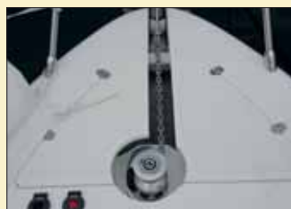
El molinete de anclas eléctrico queda visible siempre y está a la misma altura que la cubierta.