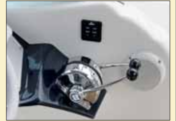
Los mandos de los motores son mecánicos.