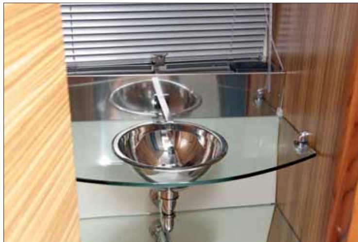
▲ El lavabo del aseo resalta por la combinación de los materiales usados.

cocinando. Debajo de la encimera se disimula a la perfección un armario de doble puerta, ya que utiliza la misma madera que las paredes y sus estrías coinciden en toda la longitud.