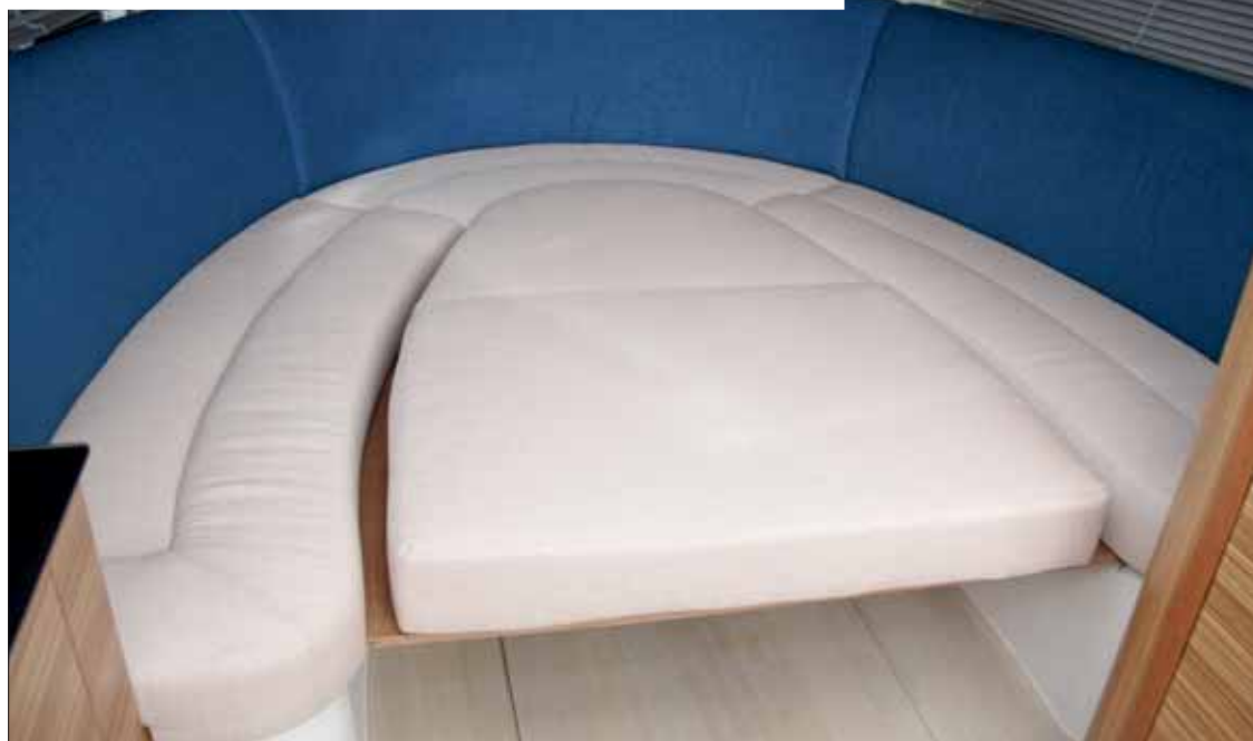
La dinette convertible de proa posibilitará la pernocta de un par de personas.