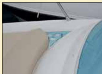
El posavasos adyacente al solárium de proa es de metacrilato azul, a juego con el parabrisas y la puerta de entrada al interior.