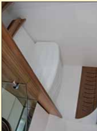
El inodoro queda cubierto por una amplia tapa que permitirá sentarse cómodamente cuando se utilice como vestidor.