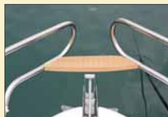
El peldaño del balcón de proa exhibe un dibujo fresado que le confiere mayor poder antideslizante.