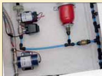
Alcanzaremos fácilmente las bombas de presión del circuito de agua dulce a través de las sentinas.