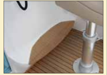
Los dos asientos giratorios incorporan unos peldaños de teca a modo de reposapiés para incrementar la comodidad durante la navegación.