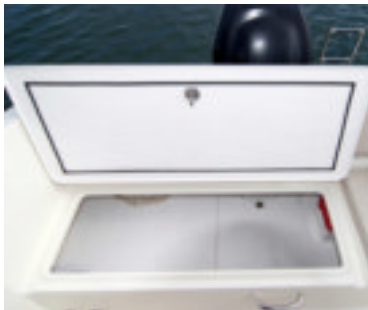
Bajo los asientos de popa encontramos amplios cofres con goma aislante para una mayor hermeticidad.