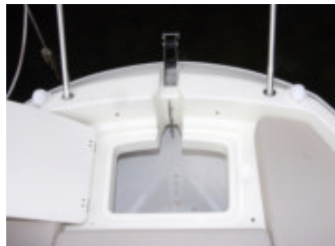
Cofre de anclas de la Sun Deck se encuentra debajo de las colchonetas del solario. Éste es profundo y admitiría un molinete de poca potencia.