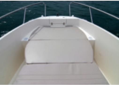
Los asientos delanteros de la Open se transforman en solario que alcanza hasta la mismísima consola.