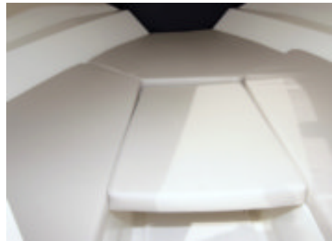
La cabina se limita a una clásica litera triangular bajo la cual hay un WC químico. Las alturas, sin ser muy altas, son suficientes para el descanso.