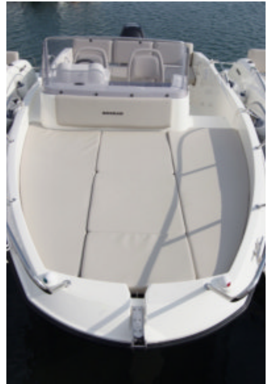
Toda la sección de proa de la Sun Deck está creada para tomar el sol. El minipasillo de estribor se hubiera podido sacrificar del todo.