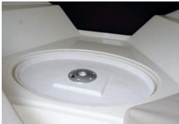
La mesa exterior se estiba bajo la tapa de un cofre de la cabina.