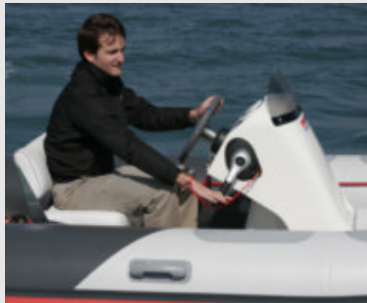
La distancia entre el piloto y la consola es adecuada. La palanca del gas está bien ubicada a Er.

Cincuenta caballos dan para mucho ya que, al fin y al cabo, se alcanzaron 30 nudos.