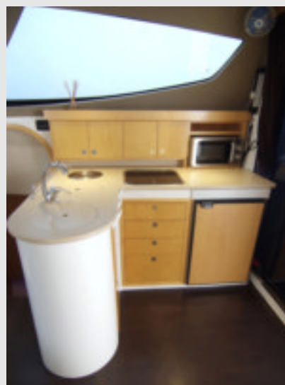
La cocina es bonita, práctica y completa. Está bien comunicada con el comedor exterior e interior. Hubiera sido conveniente que dispusiera de extractor de humos o de una ventana corredera practicada en la ventana lateral.