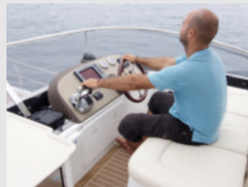
El puesto de gobierno del fly tiene capacidad para 4 personas. La consola es muy completa y está bien protegida por su elevado deflector.

El fly es determinante en el aspecto exterior del FlashCat 435, que a pesar de su gran tamaño se integra perfectamente en la línea general imprimiéndole la apariencia de embarcación moderna, actual y hasta deportiva. Los voluminosos flotadores, de considerable francobordo, elevan su cubierta plana y de cómodo tránsito. En ellos resaltan las ventanas laterales que iluminan los camarotes. La plataforma de popa dispone de segmentos de baño unidos por una sección intermedia escalonada donde es posible