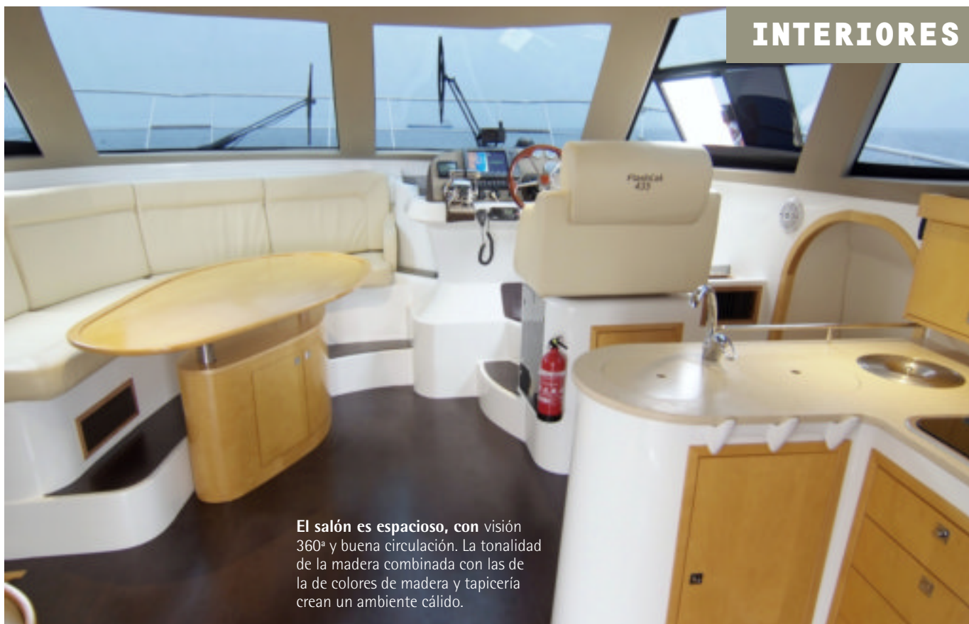
El salón es espacioso, con visión 360º y buena circulación. La tonalidad de la madera combinada con las de la de colores de madera y tapicería crean un ambiente cálido.