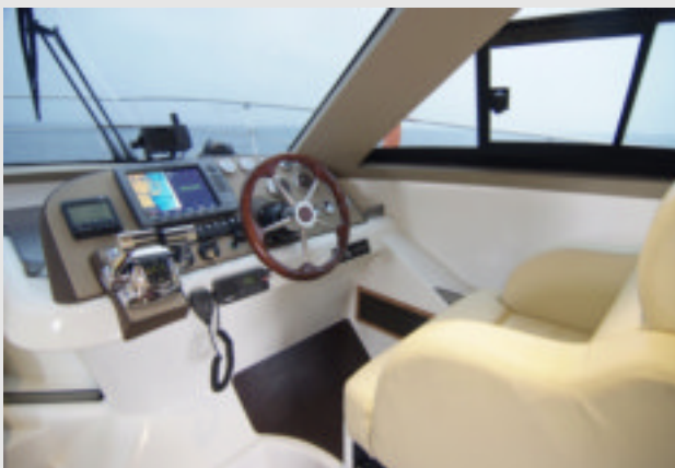
El puesto de gobierno es muy cómodo. Es regulable en distancia y dispone de una gran visibilidad. La ventilación es algo escasa.

Su desplazamiento requiere de una mayor potencia que se ofrece como opcional