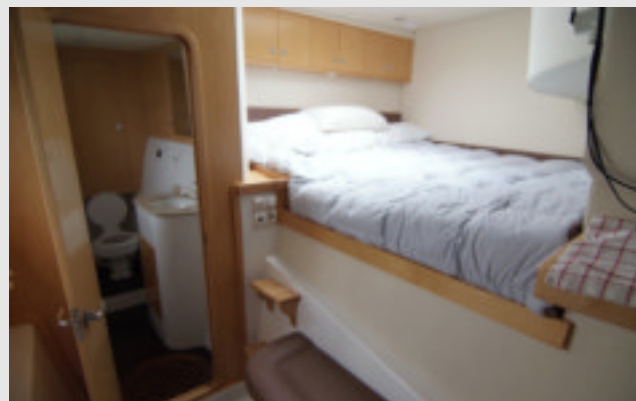
El camarote del armador, práctico y sin lujos, dispone de cama doble tamaño "king size", un baño propio y mucho espacio de estiba.

La acomodación en la cubierta inferior es simétrica pudiéndose optar en proa entre un camarote doble de armador a babor y dos literas en estribor, tal y como estaba distribuida la unidad probada; o dos camarotes dobles de menor tamaño. Ambos camarotes disponen de su propio baño, alargado, con el inodoro al fondo y la ducha al inicio. Disposición algo incómoda que, según el astillero, se invertirá en próximas unidades. La sección posterior de ambos cascos la ocupan sendos camarotes gemelos, bajo cuyas camas se encuentran los depósitos de agua y gas-oil. La ventilación en los flotadores llega de los seis portillos laterales y dos escotillas. Como era de esperar en un barco tan espacioso, los lugares de estiba tienen espacio sobrado para los enseres de diez tripulantes durante en largo crucero.