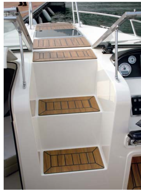
La estructura de cubierta forma unos escalones centrales para traspasar el parabrisas.

El diseño de la carena se adapta bien al peso y a la potencia del motor, a pesar de no ser la máxima admitida en catálogo. Pudimos apreciar que ésta proporciona una correcta aceleración y permite mantener un crucero bastante animado, entre 26 y 28 nudos. □ R. Masabeu