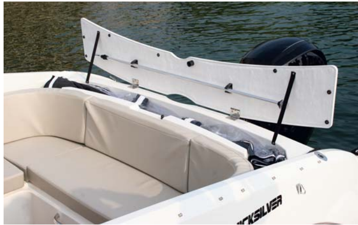
El perfil de popa es ancho, y su tapa cubre la toldilla y la luz de posición.

se encuentran situados sobre la puerta de entrada a una cabina en la que sólo se ofrece capacidad de estiba y una cama doble de tamaño suficiente.