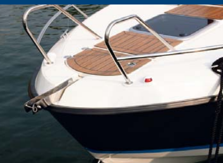
La voluminosa roldana en proa