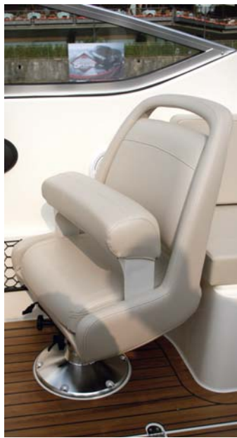
Piloto y acompañante cuentan con asientos giratorios de base practicable.

En condiciones de mar plano, sin viento y con seis personas a bor-