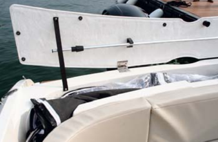
La estiba del mástil de luces.