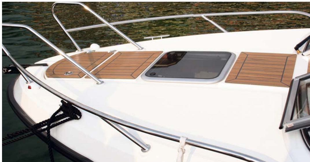
En el pasillo central, acabado en madera, se debería disponer de una escotilla enrasada.