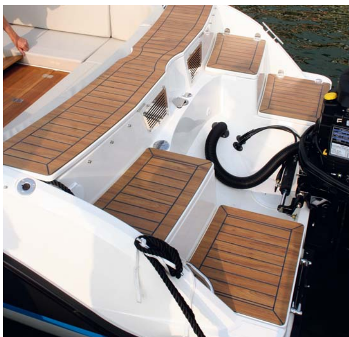
El diseño escalonado de la popa resulta tan práctico como original.

Entre las grandes novedades de Quicksilver para esta temporada, destaca la Quicksilver Activ 645 Cabin. Se presenta como una lancha de buenas prestaciones y algo de cabina, con un estilo muy propio del norte de Europa.