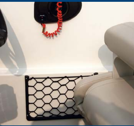
La sencilla y práctica guanterera.