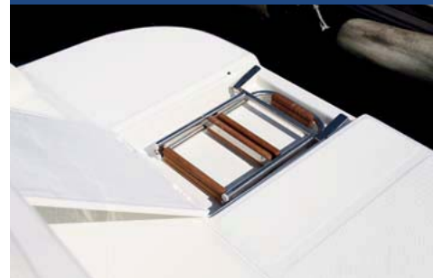
La gran escalera que se oculta.