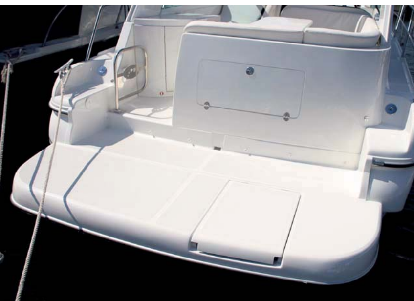
La gran plataforma es suficientemente amplia para llevar una pequeña auxiliar.

La línea Cancún de Starfisher es seguramente la más deportiva de su producción, como demuestra esta Cancun 260 Open, en la que el sol y el confort no están reñidos con los buenos rendimientos.