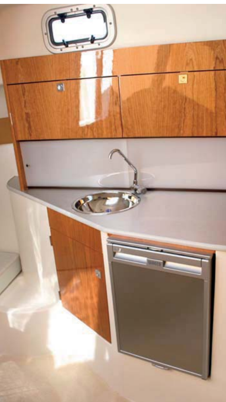
El completo mueble de la entrada puede actuar de cocina si montamos un fogón.