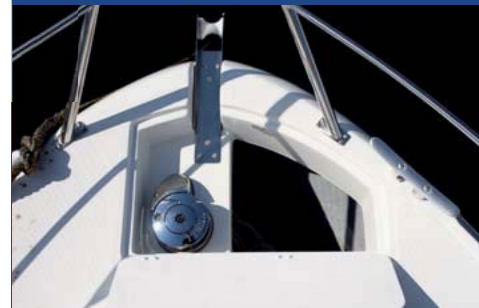
El soporte de molinete interior.