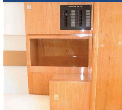
El doble armario de estiba lateral.