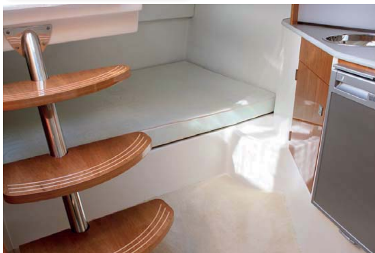
Una bonita escalera separa una cama transversal que necesita una cortina de serie.

El diseño de la carena nos sorprendió positivamente con un buen control en todo momento y cierta agilidad que le hacía especialmente divertida, manteniendo a pesar de ello la cubierta bastante seca. Por otra parte, es cierto que las reacciones más interesantes y propias de su programa de navegación, se producían a un régimen alto de vueltas, cercano a las 4.000 r.p.m. □ R. Masabeu