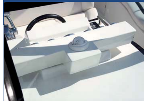
La curiosa estructura para la consola.