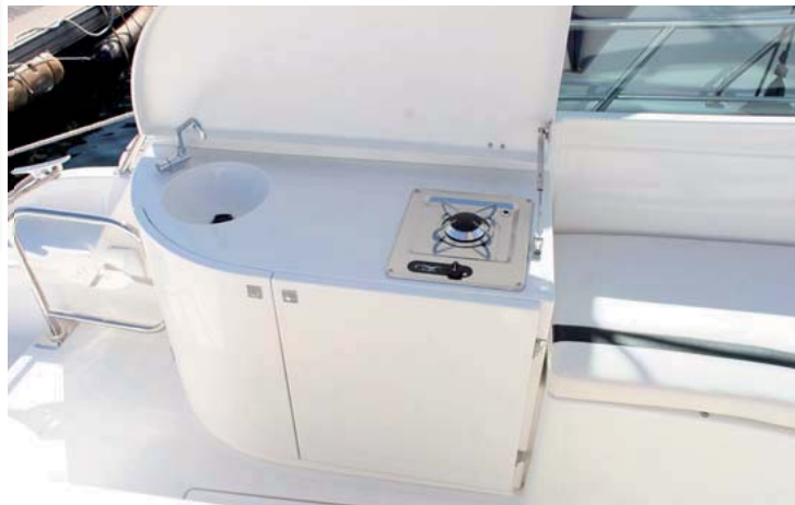
El mueble exterior ofrece un quemador, fregadero y opción de nevera.

El asiento lateral se convierte en un solárium individual.