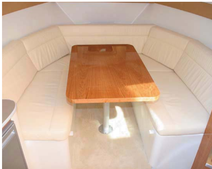
El comedor interior dispone de una mesa bastante grande que se transforma en cama doble.

ría incluir una cortina de serie para independizarla. En la parte central cuenta con una cocina sencilla, con lavamanos, nevera y espacio para un fogón portátil, además de una escotilla cenital fija. Por su parte, en la banda contraria se ubica un aseo independiente con inodoro marino. El espacio de proa se ocupa mediante un armario lateral y un comedor formado por un asiento en forma de "U" y una mesa central que puede abatirse para crear una segunda cama doble.