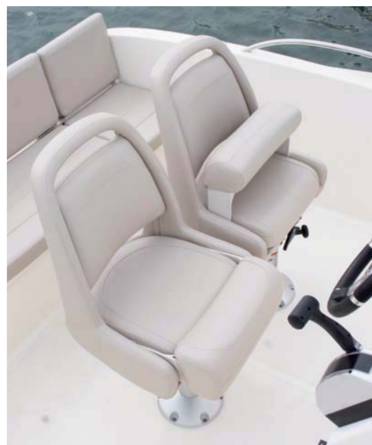
Los asientos giratorios de navegación son de base practicable.