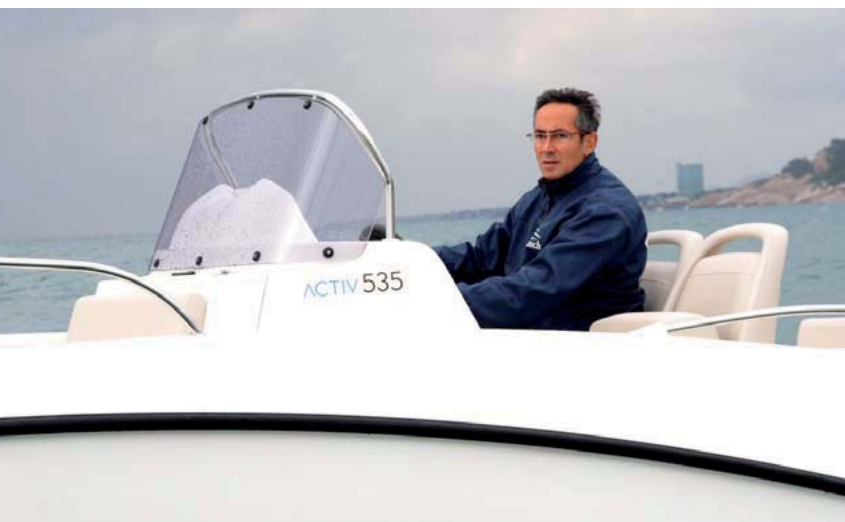
La altura del parabrisas es discreta aunque muy efectiva.

motor a precios muy ventajosos y con la máxima garantía. El reciente desarrollo de la nueva serie Activ, tan atrevida en sus líneas como actual y práctica, se ha convertido en el complemento perfecto para los