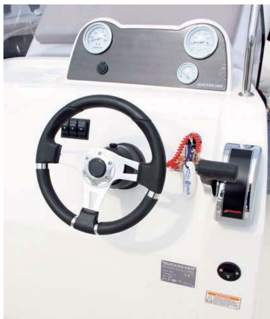
El diseño de la consola es sencillo, práctico y con buena capacidad para electrónica.

A pesar de ello registramos una velocidad máxima de 30 nudos y un interesante crucero de entre 20 y 22 nudos, con una navegación bastante suave y seca para el tamaño de la embarcación y su eslora, permitiéndonos disfrutar de su confortable y seguro comportamiento en todo momento. □ R. Masabeu