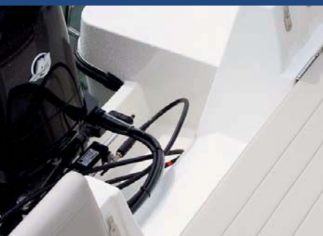
El hueco central para elevar el motor