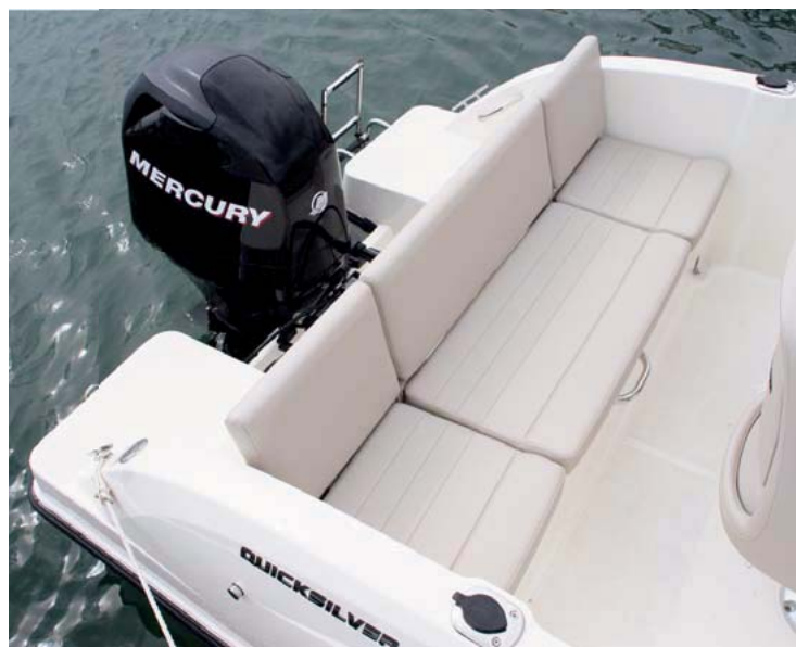
En popa incluye un asiento de banda a banda con respaldos desmontables.

La parte posterior de la bañera se destina a un largo asiento que ocupa toda la manga interior, con diferentes secciones