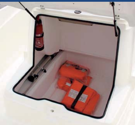
El cubículo de estiba en consola