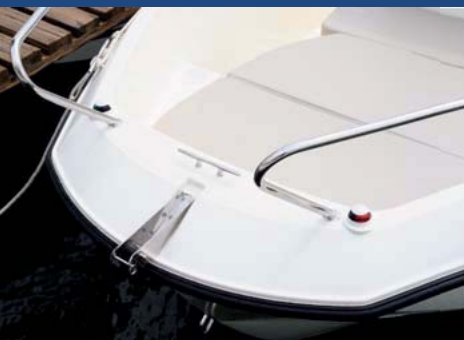
La cornamusa central y la roldana para el ancla