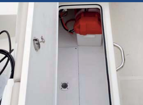
La Tapa que cubre la sentina en popa