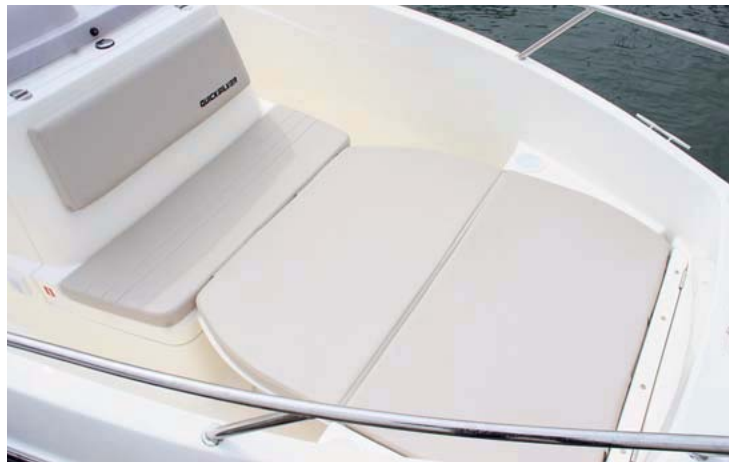
Una tapa plegable permite disponer de un práctico solárium en proa.

rísticas líneas angulosas y su forma de cubierta. Es, en definitiva, una embarcación que resulta especialmente amplia para su eslora.