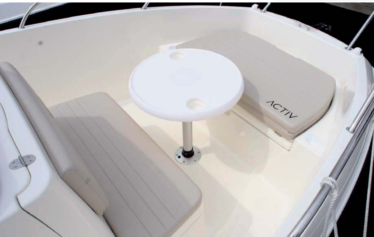
Una mesa redonda desmontable crea una dinette en proa.

motores fuerabordas Mariner y Mercury, con los que asegura unas buenas prestaciones y una perfecta adaptación a las más variadas necesidades. La Activ de Quicksilver, que traemos a estas páginas, es uno de los últimos modelos presentados y de los que mantiene más marcadas las caracte-