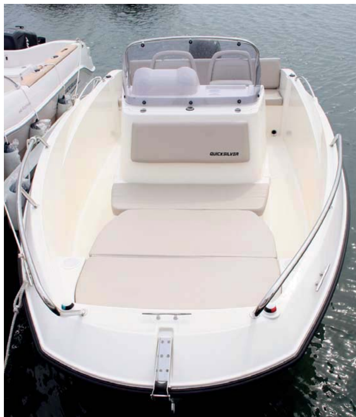
La forma cuadrada de la proa posibilita una entrada muy ancha.