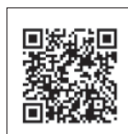
Video Quicksilver Activ 755 Weekend (Quicksilver)

La bañera es un punto fuerte de este modelo, tanto por su espacio como por sus posibilidades de transformación en dinete, solárium o espacio para pesca. La modularidad de este espacio es sin duda uno de los atractivos de este crucero, ya que el gran cuadrado de la bañera ofrece distintas posibilidades combinando las distintas piezas: un gran sofá el L, con un banco a lo largo de la