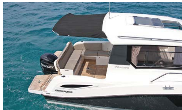
Una toldina extensible protege del sol a los ocupantes de la bañera.