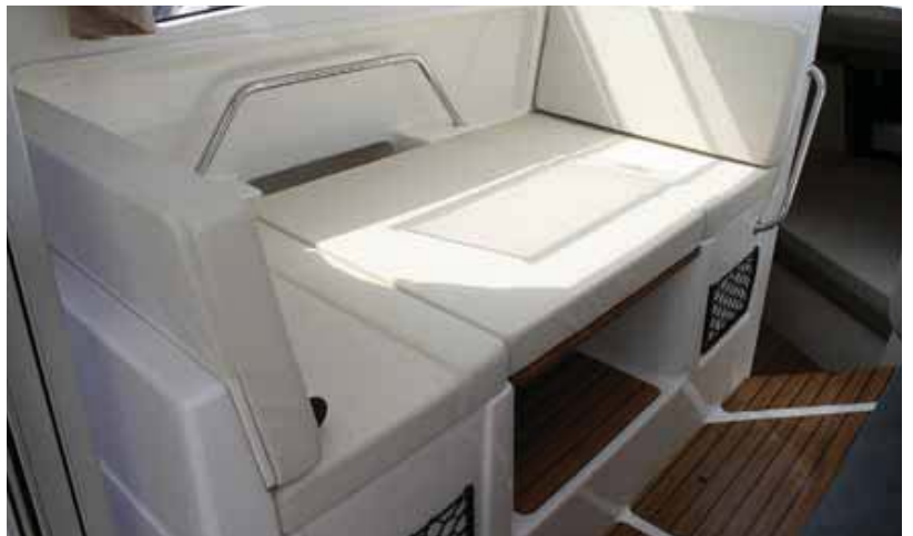
El comedor puede transformarse en cama.