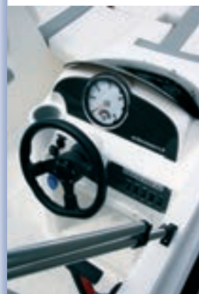
Gran tacómetro central.