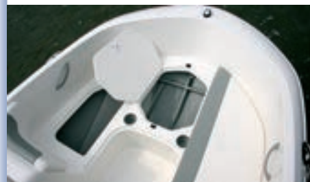
Casco interior reforzado.