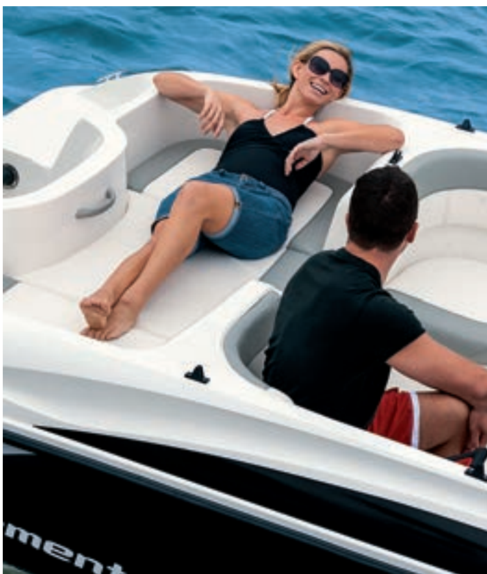
El asiento posterior puede utilizarse como un solárium transversal.