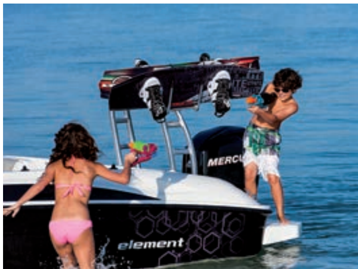
El arco de arrastre puede soportar anclajes para tablas de wake.

Sobre una carena de original diseño, Bayliner ha desarrollado una lancha de gran capacidad de asiento y especiales aptitudes para la navegación de iniciación.