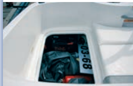
Capacidad de estiba bajo asientos.