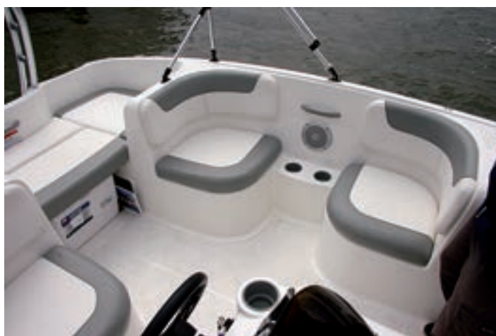
Se han distribuido una gran cantidad de asientos en todos los rincones.

Con el montaje a bordo de un fueraborda estándar Mercury de 60 hp, estuvimos navegando en unas condiciones de mar rizada con unos 15 nudos de viento, con las que pudimos alcanzar una velocidad máxima de 28 nudos, siempre con un perfecto control del rumbo, sobre todo con un ritmo de crucero entre los 19 y los 22 nudos, en los que se mostraba especialmente confortable. □ R. Masabeu