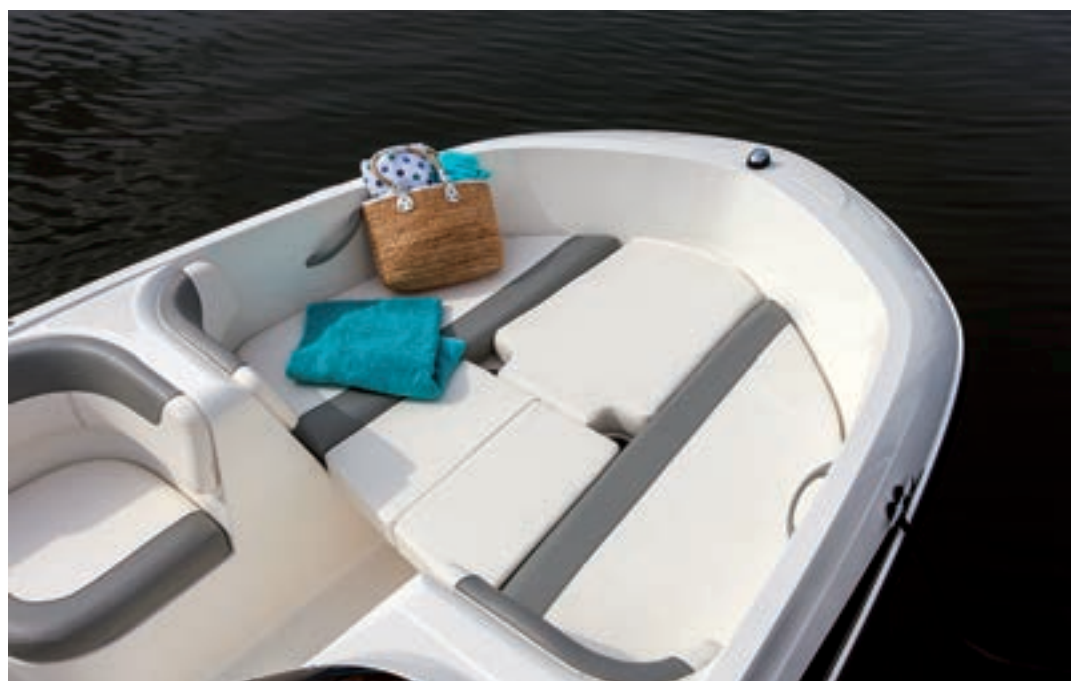
Unos suplementos forman en proa un generoso solárium.