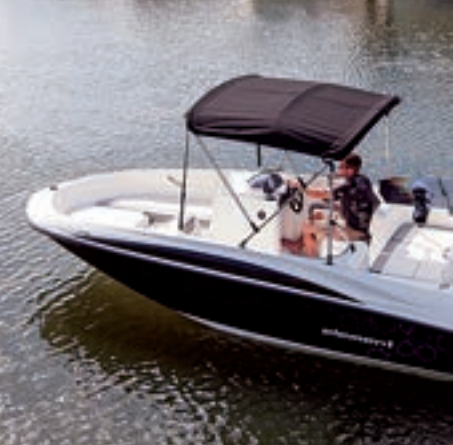
Es posible montar una toldilla plegable para protegernos del sol.

como hidrodinámica, proporcionando una estabilidad a toda prueba, como pudimos comprobar durante la navegación, incluso desplazando a todos los pasajeros a una banda, así como una navegación muy confortable en la que la escora es mínima incluso en giros muy cerrados.