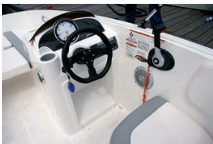
El puesto de gobierno es bajo, sencillo, práctico e incluye reposapiés integrado.