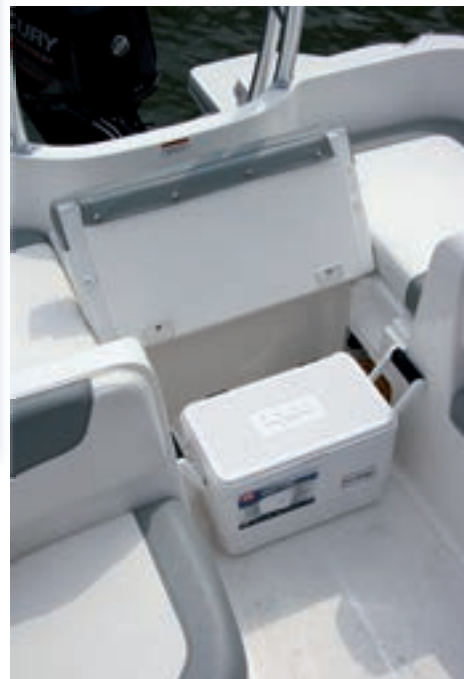
La nevera de arcón, portátil, se estiba bajo el asiento de popa.

dos plataformas de baño adosadas, con una escalera de estiba exterior encajada en el molde.