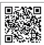
Vídeo Bayliner Element 160 (Bayliner Boats)

1. La acertada distribución de la bañera en la Element es uno de sus puntos fuertes.